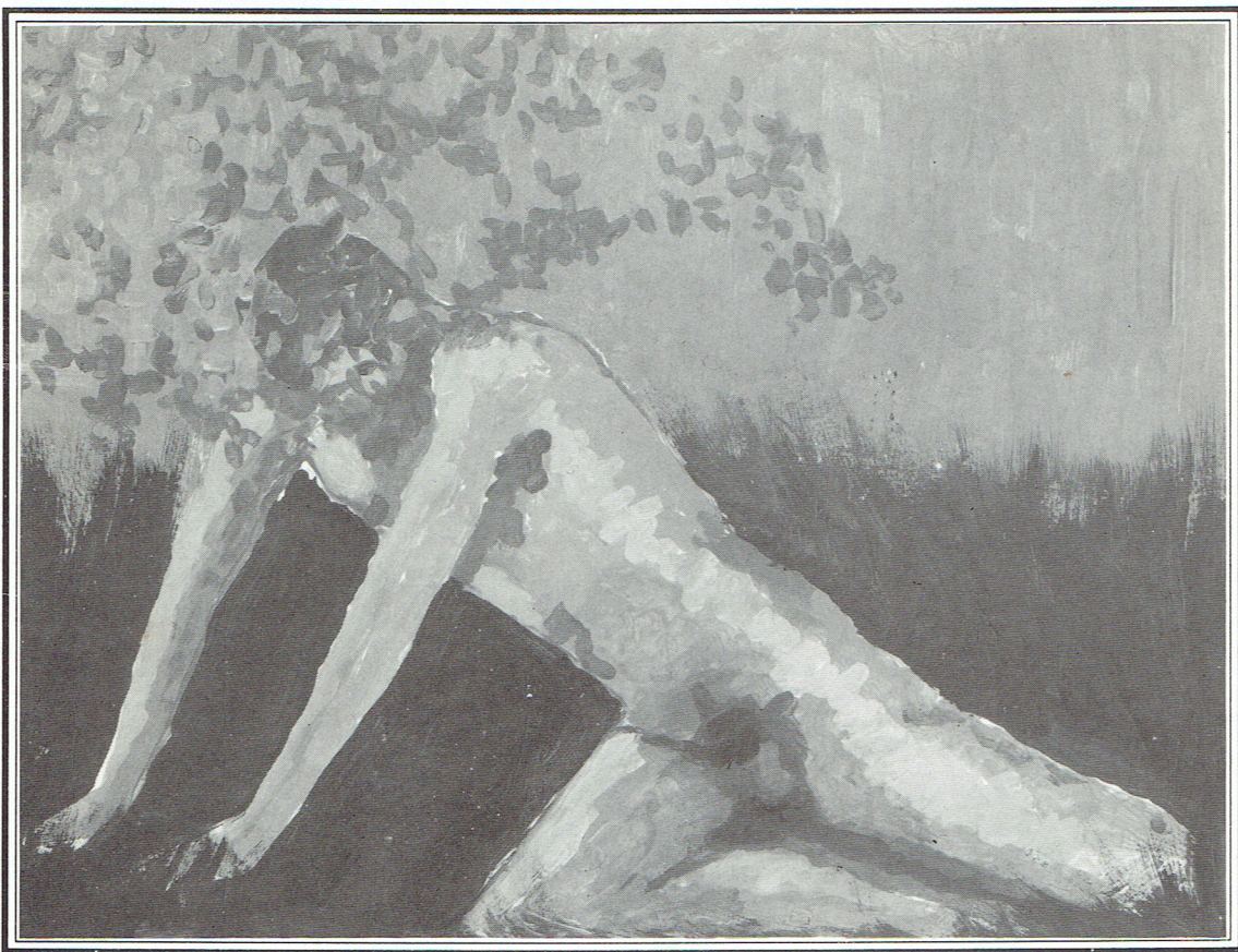
1984 - EN HOMENATGE A XÀTIVA

Massa ho sabia, ell, que els cossos, a l'endemà mateix de la baralla, serien l'aliment per a les mosques.