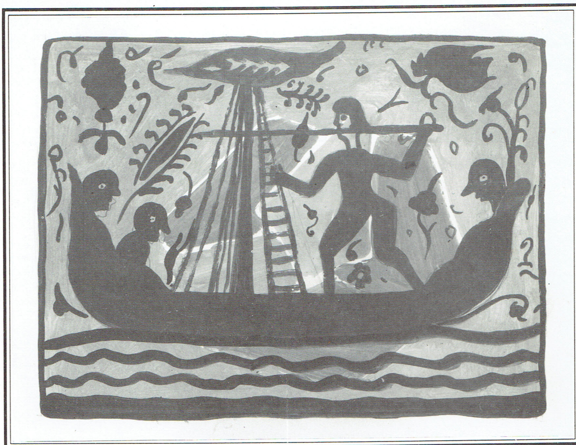
1985 - SOCARRATS DE PATERNA

Recupera el passat i se l'apròpia amb heretgia venial i no definitiva. I amb idea remota de maridatge adjunta la terra-cuita i el cartò i mamprén una mica la insolència per a desllavassar la idolatria de l'ornament, ara per ara irrepètible i desautoritzat en les temàtiques.