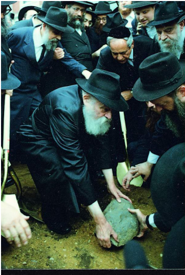
כ"ק אדמו"ר מלך המשיח שליט"א במעמד הנחת אבן הפינה

עד לשנים האחרונות, אוחסנו כלי 'הלשכה' בכל מיני פינות ב-770 מבלי שיהיה לזה מקום מסודר. לאחר שבנו והרחיבו את הכניסה החדשה ל-770 - הרחיבו ופתחו גם מתחת לעזרת נשים איסטערן פארקווי - ואז שיכנו את 'הלשכה' בחדר מיוחד - שם הוא מקומה הנוכחי עד היום הזה.