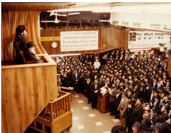
כ"ק אדמו"ר מלך המשיח שליט"א על המרפסת שנבנתה בשנת תשנ"ג

כל אותה העת נשען הרבי על גבי הסטענדער מוטה קמעה לכיוון הדובר והביט בו בעיניו הק'.