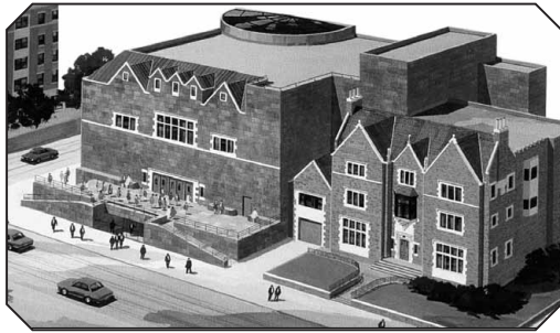
הדמית הבניין החדש