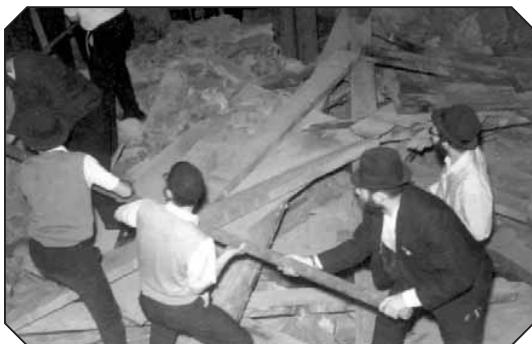
הבחורים שוברים את הקיר