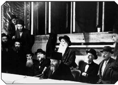
הרבי מתנועד בשאלאש לאחר השיפוח

770), בנה בימה לקריאת התורה. הבימה הוכנה לקראת שמחת תורה. עד אותה שנה, היו הבימות של קריאת התורה נשברות מידי שנה בשמחת תורה בגלל הלחץ והצפיפות. בפעם הזאת בנה ר' יענקל בימה שהיתה עשויה (כמעט כולה) מקשה אחת, וזו אכן הצליחה לעמוד בתנאים הקשים במשך כשלושים שנה, עד שנת תשמ"ט אז הוחלפה בחדשה.