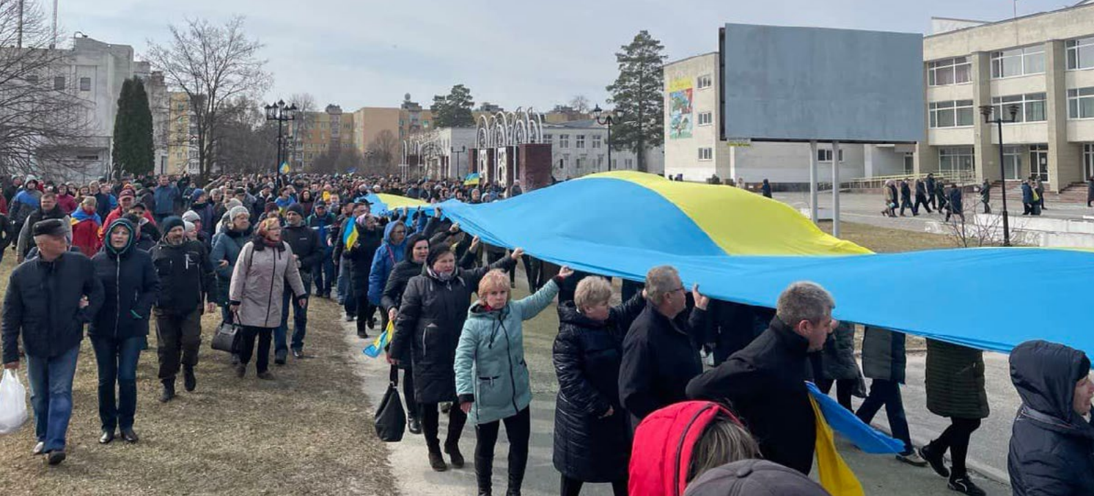
Мітинг у Славутичі з розгортанням великого українського прапора.