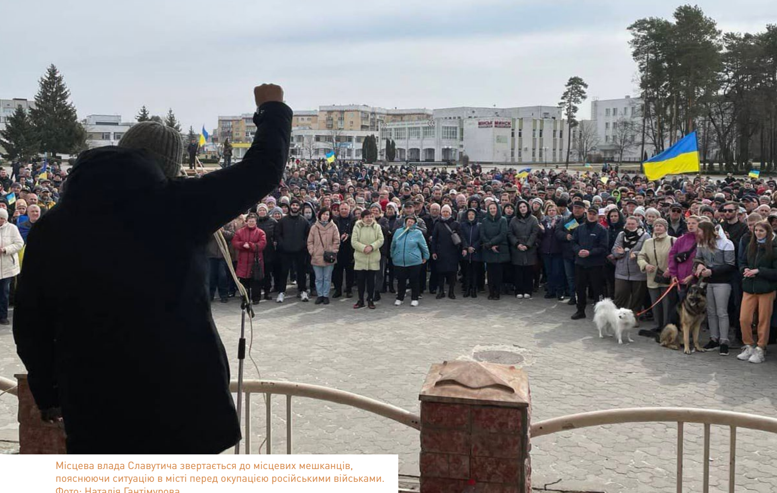
Місцева влада Славутича звертається до місцевих мешканців, пояснюючи ситуацію в місті перед окупацією російськими військами.

довжуються, в тому числі офіційними особами в російській адміністрації 107 .