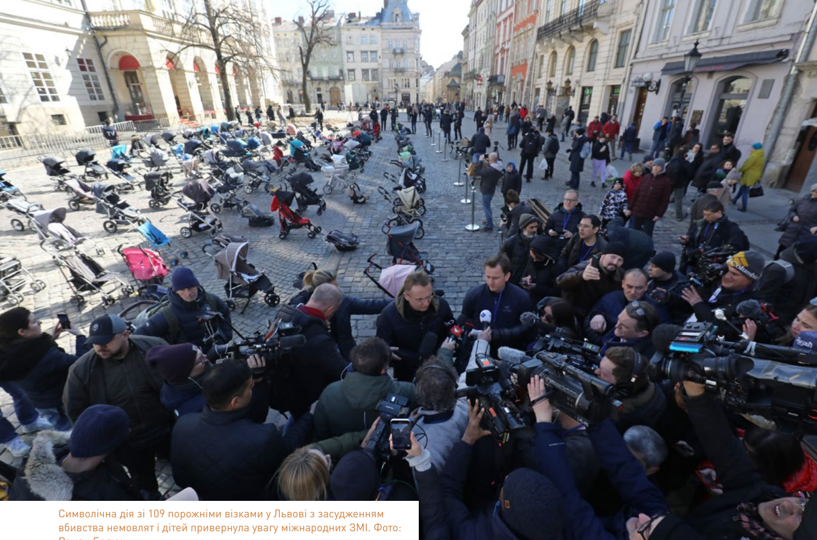
Символічна дія зі 109 порожніми візками у Львові з засудженням вбивства немовлят і дітей привернула увагу міжнародних ЗМІ.

ряд різних стратегій 101 . У цьому контексті цивільно-військові взаємодії поглиблювалися. Наприклад, через обмін інформацією для ідентифікації російських диверсантів та позицій, спорудження антитанкової інфраструктури, злам російської цифрової інфраструктури 102 чи саботаж військової техніки 103 . Також поширеною була практика серед центрів громад будувати відповідну інфраструктуру і готувати коктейлі Молотова.