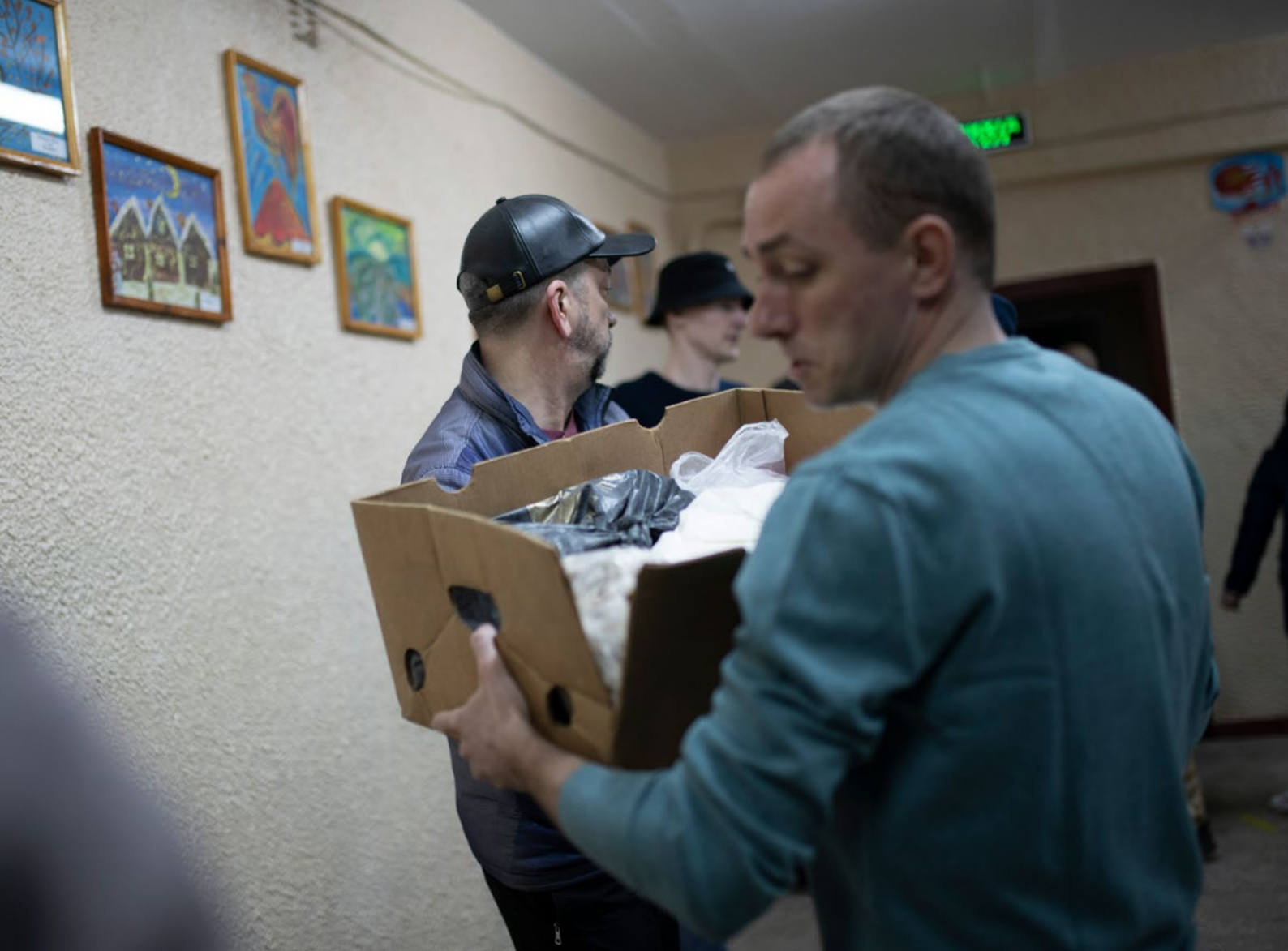
Завантаження гуманітарної допомоги у вантажівку в Славутічі.

З 2015 року він кілька разів був фігурантом судових справ і був ув'язнений на 524 дні як «російський агент» 117 .