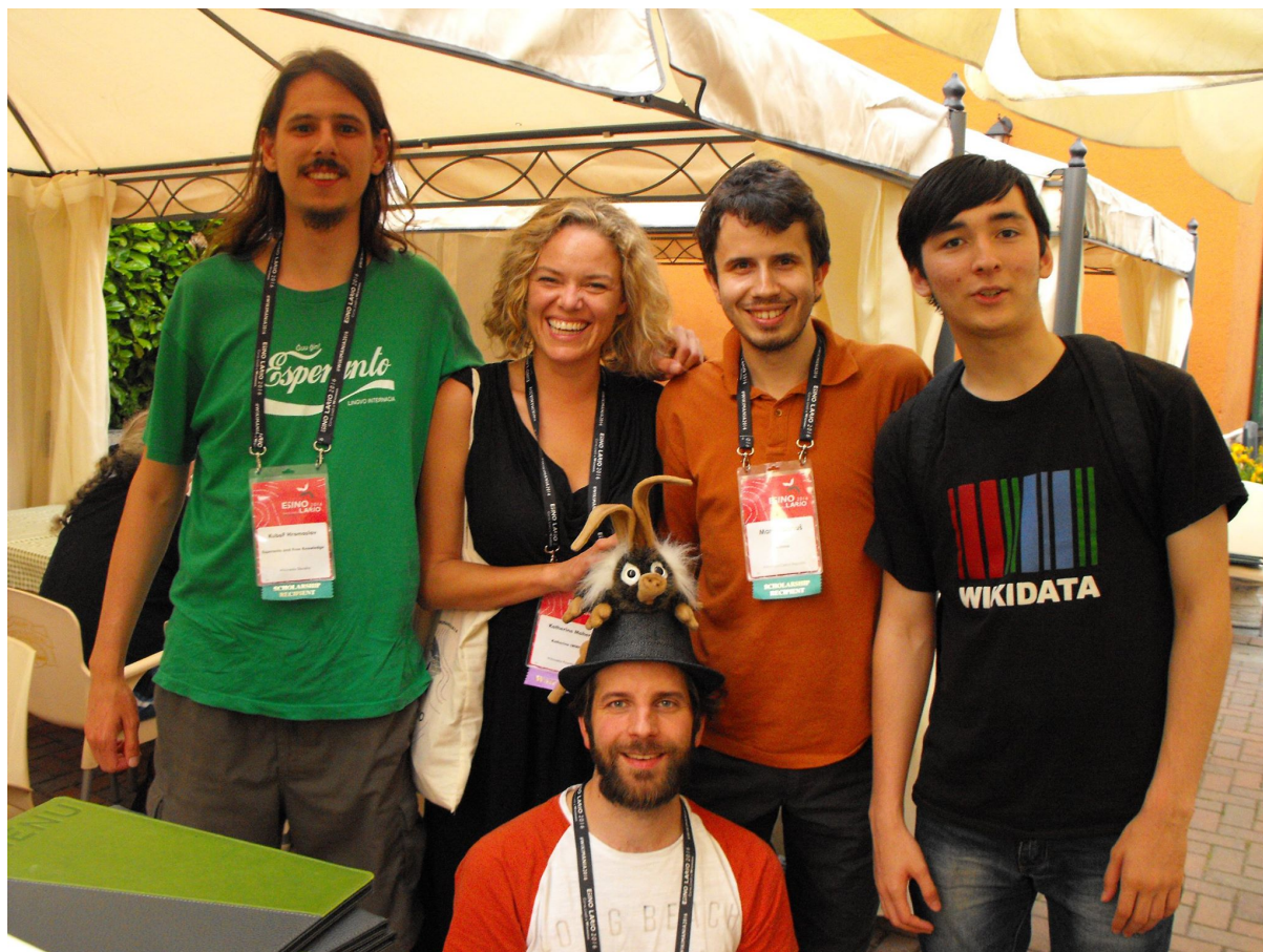
Aktivuloj de VMEO dum Vikimano 2016 renkontiĝis kun Katherine Maher, tiam novelektita Plenuma Direktoro de la Fondaĵo Vikimedia