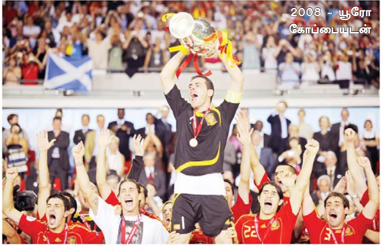
2008 - யூரோ கோப்பையுடன்