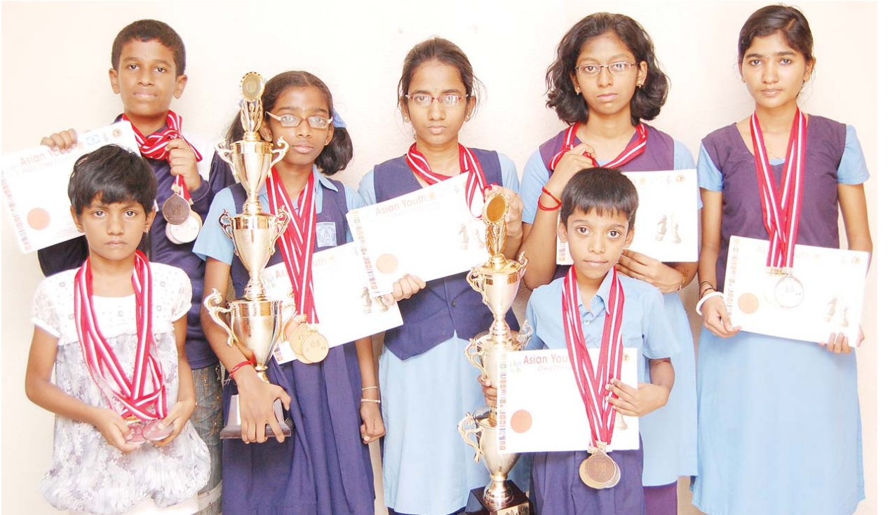
இலங்கையில் நடைபெற்ற ஆசிய ஜூனியர் செஸ் போட்டியில் 2 தங்கம், 2 வெள்ளி, 3 வெண்கலப்பதக்கங்களை வென்ற சென்னை வேலம்மாள் பள்ளி மாணவ, மாணவியர்களை படத்தில் காணலாம்.