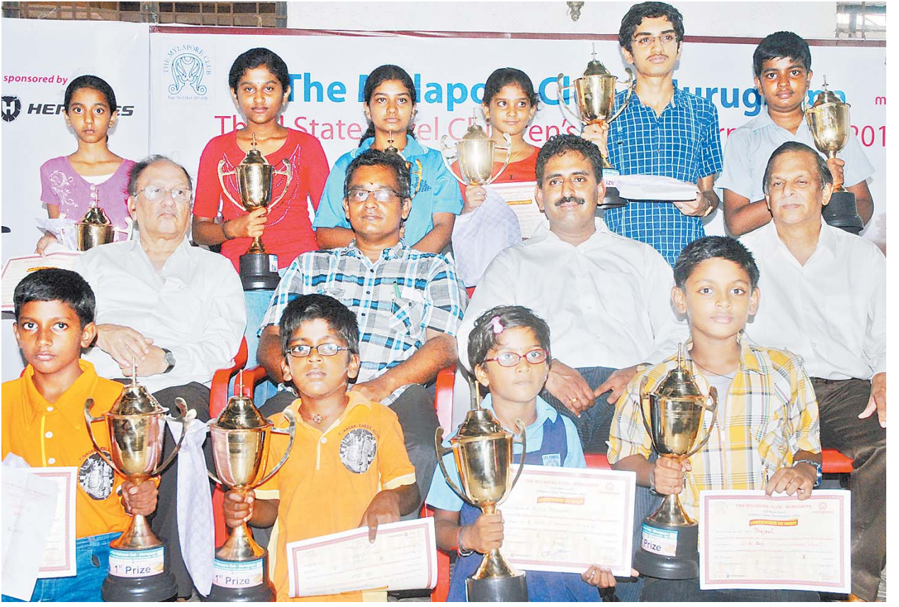
சென்னையில் நேரு ஸ்டேடியத்தில் உள்ள ஹால் ஆப் செஸ் அரங்கில் மைலாப்பூர் செஸ் கிளப் முருகப்பா குழுமத்தின் ஆதரவோடு நடத்திய போட்டியில் பல்வேறு வயதுப்பிரிவில் வெற்றி பெற்ற வீரர், வீராங்கனைகளை படத்தில் காணலாம்.