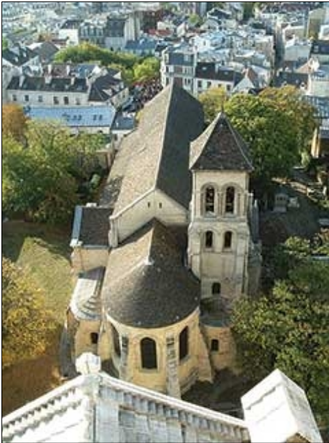
ශාන්ත සේවියර් ජීවත්වූවා යැයි කියන දේවස්ථානය

1505 දී පෘතුගීසීහු මෙරටට පැමිණි පසුව රජවරුන්ගේ අසමගිකම් ප්‍රයෝජනයට ගනිමින් ඉතා කෲර ලෙස ලක්දිව පාලනය කළහ. මේ අතරතුර අම්බන ප්‍රදේශයේ නරක් නොවී තිබෙන දේහය දැක ගම්වාසීන්ගේ විරෝධය ද නොතකා එම දේහය දොඩන්දුව වරායෙන් ගෝවේට ගෙන ගිය බව පැවසෙන පැරැණි ජන කවි දෙකක්ද අදටත් එම ප්‍රදේශයේ ජනතාව අතර පවතී. පෘතුගීසීහු ගෝවේ තිබෙන මෙම දේහය ශාන්ත සේවියර්ගේ යැයි කියමින් ගෞරව දක්වති.