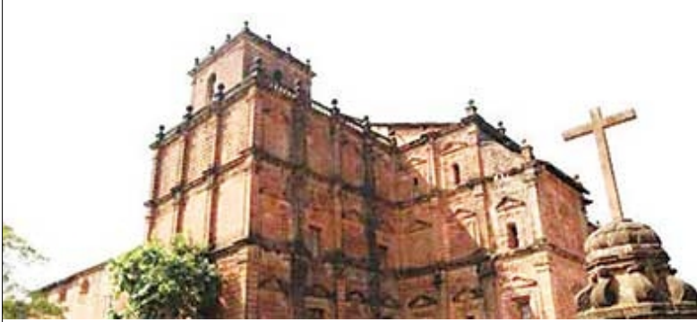
රාහුල හිමියන්ගේ දේහය තැන්පත්කර ඇති ගෝවේ වෙල්හා බැසිලිකාව

වර්තමානයේ ඉන්දියාවේ ගෝවේහි "ජේසු ජන්ම බැසිලිකා" නම් පල්ලියෙහි 16 වැනි ශතවර්ෂයේ විසූ ශාන්ත සේවියර්පියතුමාගේ දේහය යැයි විශ්වාස කරන දේහයක් තිබේ. තිබෙන වාර්තාවලට අනුව මෙම දේහය මිය ගිය පසු කිසිම දිනෙක "එම්බාම්" කර නොමැති අතර බොහෝ කලක් ඉතා හොඳ තත්ත්වයේ තිබී දැන් කෙමෙන්