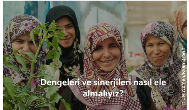
Birbirleri ile rekabet halindeki politika hedefleri arasındaki dengeleri ve sinerjileri anlamak, sürdürülebilir gıda sistemlerine ulaşmada kilit rol oynuyor.

Mevcut gıda sistemlerinin hem sağlık hem de çevre üzerinde olumsuz bir etkisi vardır. Gıda sistemleri konusunda alışılmış yaklaşımın sürdürülmesi, küresel sera gazı emisyonlarına katkıda bulunan bir faktördür ve Paris Anlaşması tarafından belirlenen hedeflere ulaşma çabalarını baltalayacaktır. Gıdaya yetersiz erişim ciddi bir sorun olmaya devam ederken dünyada giderek daha fazla insan, mikro besin eksikliği ve obezite gibi diğer yetersiz ve dengesiz beslenme biçimlerinden etkileniyor. Sağlıksız beslenme aynı zamanda dünyada hastalık ve ölüm için en büyük risk faktörünü oluşturuyor. Ayrıca doğal kaynaklar, yaban hayatı, biyolojik çeşitlilik ve ekosistemler üzerindeki baskı her geçen gün artıyor. Bu nedenle, sera gazı emisyonlarını azaltmak ve herkes için daha sağlıklı gıdalar sağlamak için gıda sisteminin tüm aşamalarında dönüşüme ihtiyaç duyuluyor.