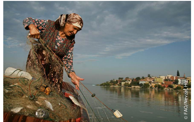
İlk iki çevrimiçi seminer, 19 Ekim 2020 tarihinde Azerbaycan ve 14 Aralık 2020 tarihinde Kırgızistan özelinde olmak üzere 2020 yılında düzenlendi.

Proje kapsamında düzenlenen çevrimiçi seminerler dizisi, faydalanıcı ülkelerden temel paydaşlar için bir bilgilendirme, tartışma ve ağ kurma platformu sunuyor ve her ülkede balıkçılık ve su ürünleri yetiştiriciliği sektörünün durumu hakkında en son gelişmelerin paylaşılmasını sağlıyor. Seminerler, COVID-19 salgını ile bağlantılı durum dâhil olmak üzere balıkçılık ve su ürünleri yetiştiriciliği sektörleri özelinde deneyim, başarı hikâyeleri, fikirler ve zorlukların paylaşılması ve paydaşlar arasındaki ticaret ve yatırım fırsatlarının kolaylaştırılması için ortam sağlıyor.