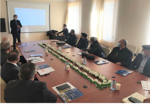
Şemkir, Azerbaycan. Ülkede gıda kaybı ve israfına dair genel resmin ortaya koyulması amacıyla Samuh, Şemkir ve Tovuz'da ilgili paydaşlarla toplantılar düzenlendi.

yönetilmesini destekleyip desteklemediğini veya tam tersine buna engel teşkil edip etmediğini tespit edecek.