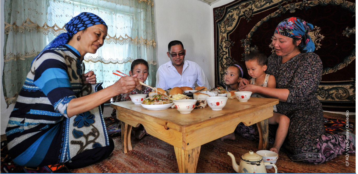
Gıda güvenliği ve doğal kaynakların sürdürülebilir yönetimi için ortaklık