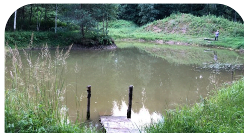
Утром мы купались в нашем лесном озере, в Шираме.