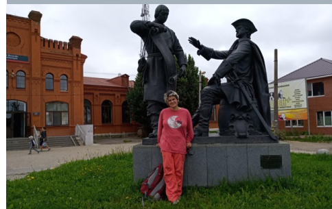
Днем уже были в Вышнем Волочке у памятника Петру Первому