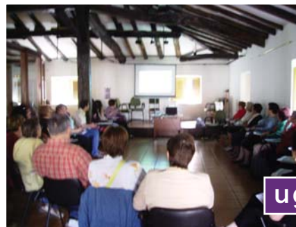
"Ugao-Miralalseko emakume eta gizonen erantzukidetasuna berdintasunezko bizitza pertsonala, familia eta lana izateko". "Corresponsabilidad entre hombres y mujeres de Ugao-Miraballes para una vida laboral, personal y familiar igualitaria". AYTO. UGAO-MIRABALLES. Palacio Jane.