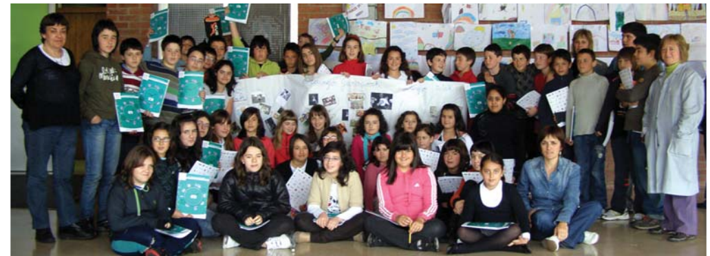
"Denok guztirako, dena denontzat". "Todas y todos para todo, todo para todas y todos". ERALDATZEN. Gainzuri Ikastetxea. Urretxu.

INFORMAZIO GEHIAGO: IDAZKARITZA TEKNIKOA OREBE: emakunde.foro@orebe.net - Tel. 943 45 66 25 - Fax. 943 45 71 08