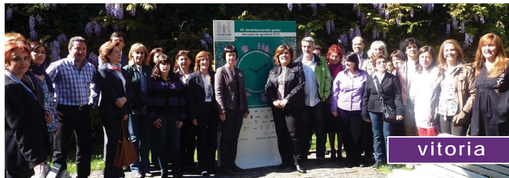
2010 Foroaren aurkezpena. Presentación foro 2010. EMAKUNDE.