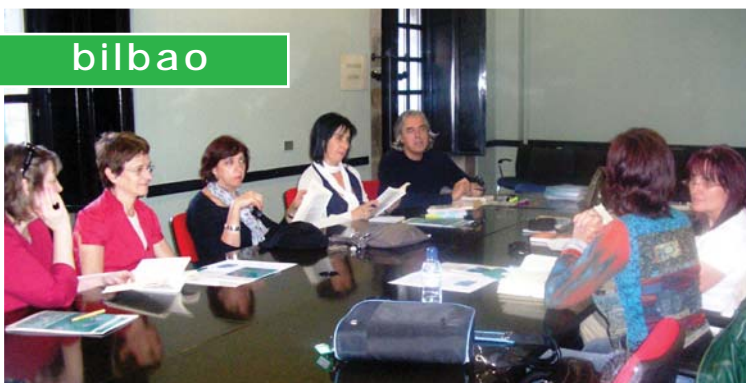
Centro Cívico La Bolsa.