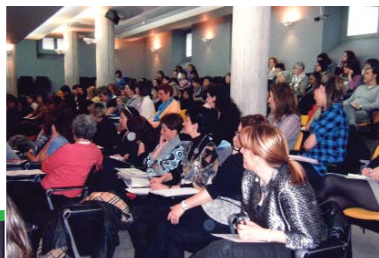
"Gizarte antolaketa erantzukiderako proposamenak". "Propuestas para una organización social corresponsable". MOD. PSICOSOCIAL DEUSTO S. IGNACIO. Colegio Abogados de Bizkaia.