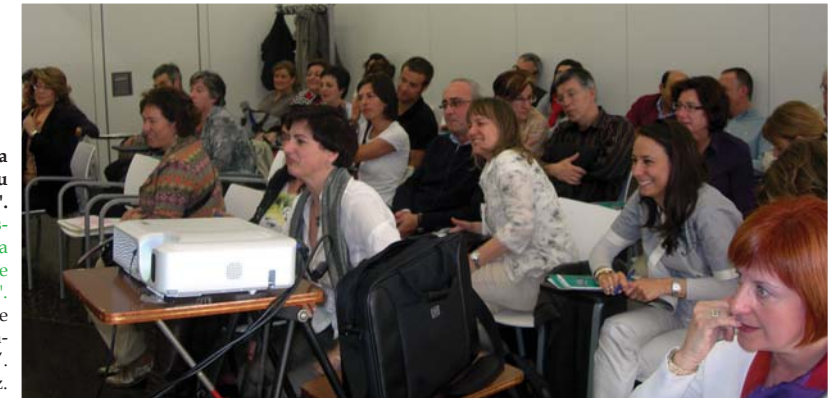
"Bateratze arduratsua Arabako Foru Aldundian". "Conciliación corresponsable en la Diputación Foral de Álava". Diputación Foral de Álava. Aula de formación "La Blanca". Vitoria-Gasteiz.

Las últimas páginas incluyen información para las entidades interesadas en participar en la edición de 2011 . Animaros y participad organizando alguna de vuestras actividades durante esos días. ¡Todas y todos ganaremos!