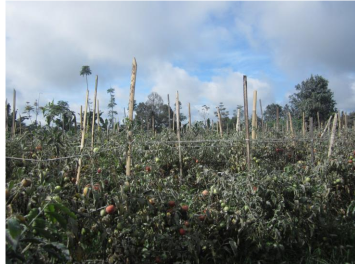
Kondisi lahan pertanian yang rusak karena abu vulkanik