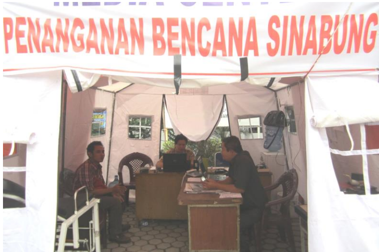
Koordinasi dengan Pemerintah Kab. Karo