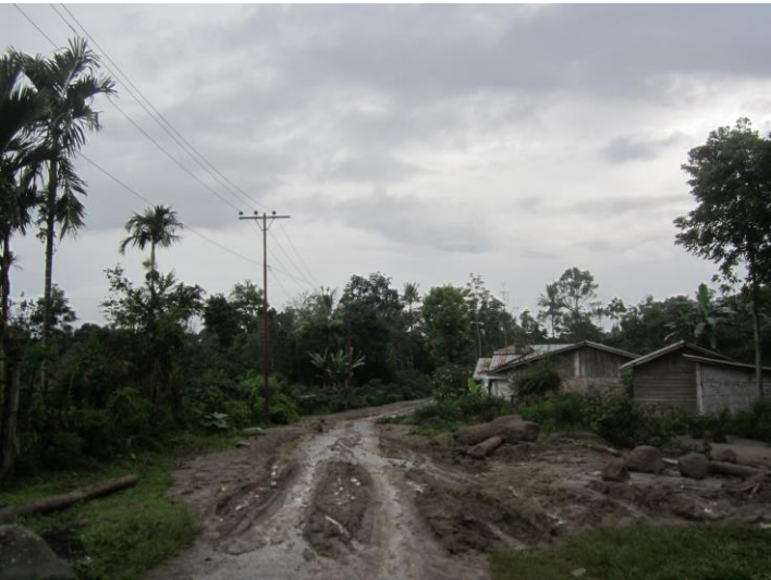
Kondisi Jalan di Desa Guru Kinayan yang penuh dengan lumpur vulkanik