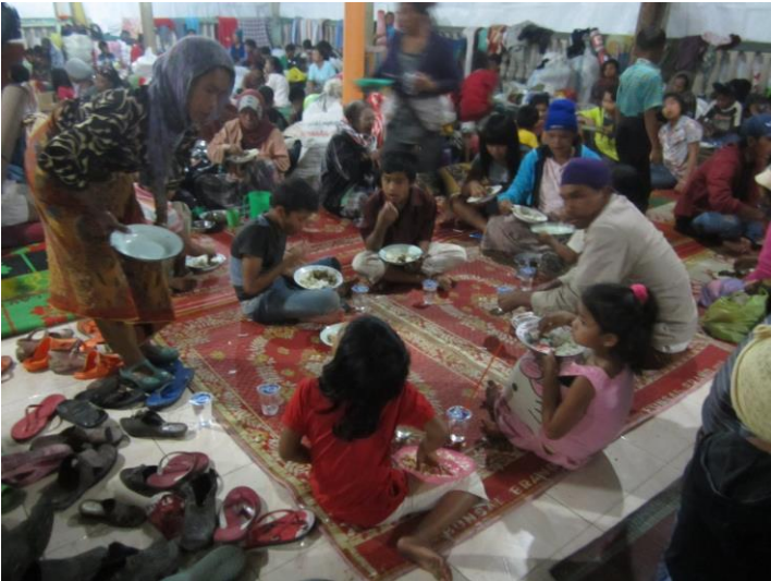
Penyintas sedang makan malam di LOSD Desa Naman