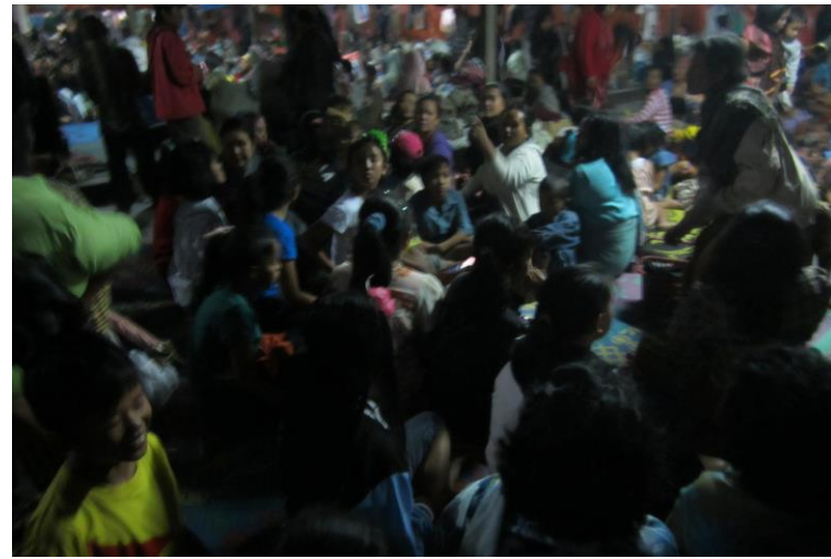
Situasi Penampungan Sementara di malam hari (LOSD Tiganderket)