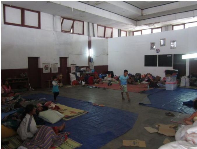
Situasi Penampungan Sementara di siang hari (Gedung Serbaguna/KNPI) Kabanjahe