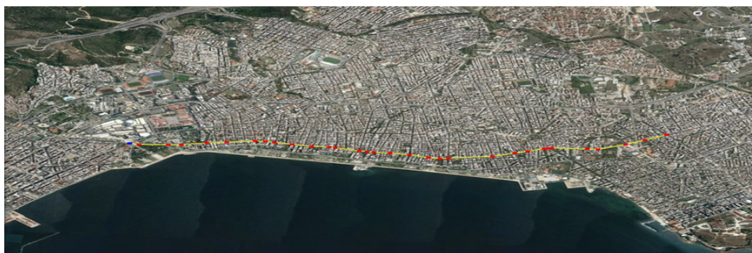
Οδός Εθνικής Αντιστάσεως - Λεωφόροι Βασιλίσσης Όλγας & Βασιλέως Γεωργίου Α' - Οδός Μανόλη Ανδρόνικου - Πλατεία ΧΑΝΘ

Στο Πρόγραμμα της Θεσσαλονίκης περιοχή παρέμβασης έχει οριστεί ο Ανατολικός οριζόντιος άξονας κυκλοφορίας που ορίζεται με αφετηρία το αμαξοστάσιο του ΟΑΣΘ στο Φοίνικα (στα όρια του Δήμου Καλαμαριάς) και διαπερνώντας την Οδό Εθνικής Αντιστάσεως, τις Λεωφόρους Βασιλίσσης Όλγας, Βασιλέως Γεωργίου Α' και την Οδό Μανόλη Ανδρόνικου καταλήγει στην Πλατεία της ΧΑΝΘ (στα όρια του Δήμου Θεσσαλονίκης).