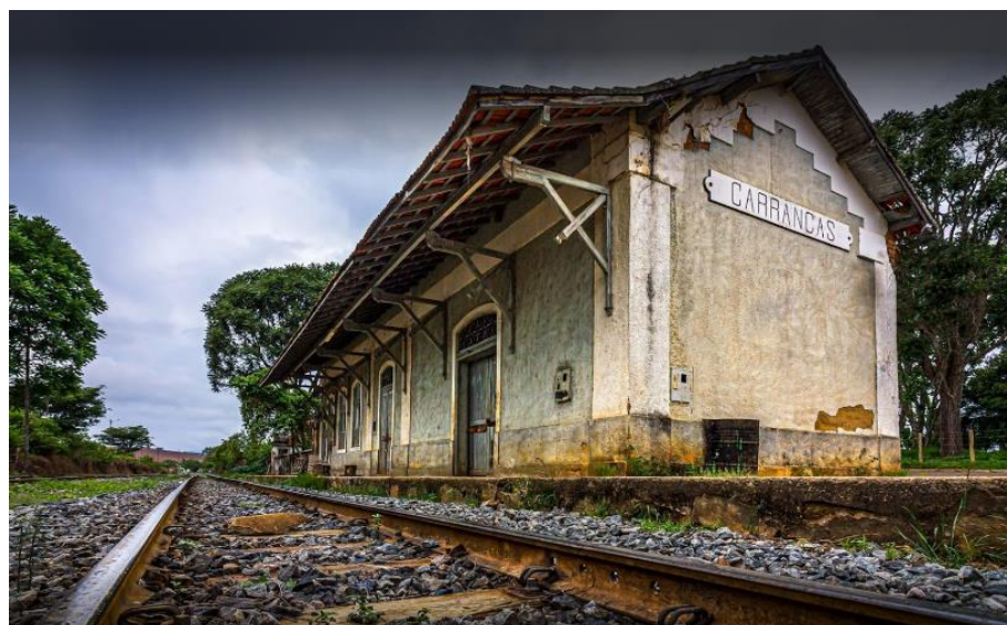
Estação de Carrancas

A Estação Ferroviária de Carrancas não é tombada e está relativamente bem conservada, se comparada com a Estação de Lavras.