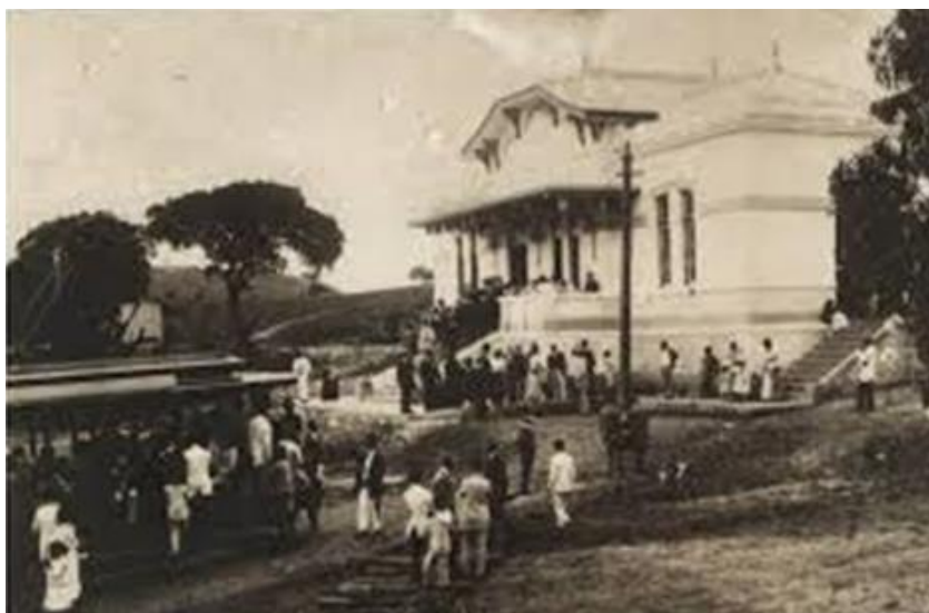
Estação de Lavras (versão original).

Dentre as estações históricas de Lavras, o prédio da Estação de Lavras, que originalmente constituía um cartão de visitas da cidade, atualmente se encontra abandonado, demolido em partes e, portanto, desfigurado.