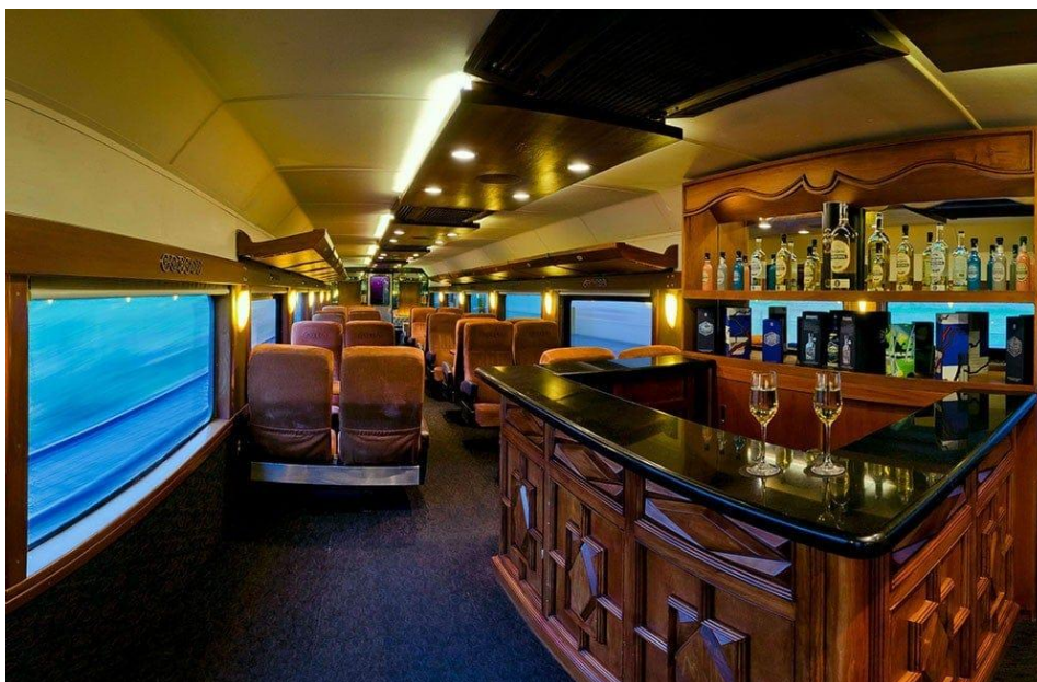
Jose Cuervo Express (2021)

Modelos de vagão Cantina/Choperia que devem inspirar o projeto de reforma e adaptação.