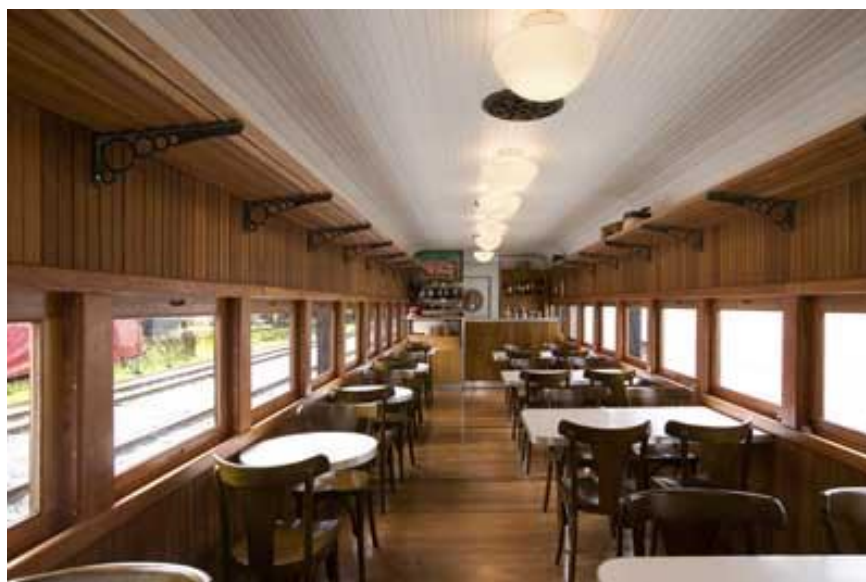
Trem da Vale (2021)