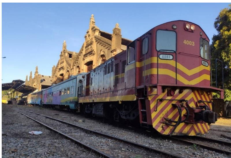
Locomotiva GL8 e dois vagões de passageiros que serão pintados