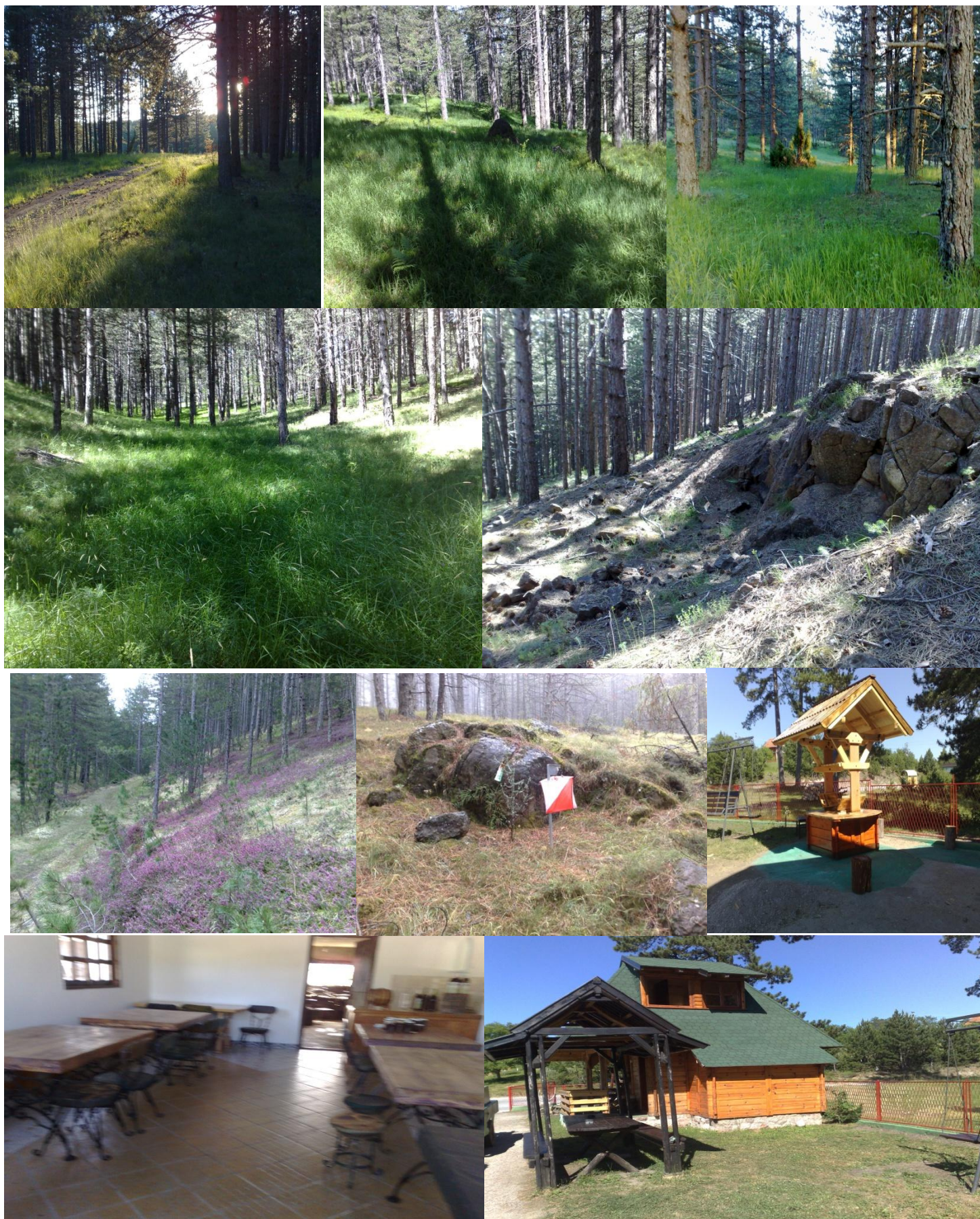
ТЕРЕНИ ЗА ТАКМИЧЕЊЕ И ТАКМИЧАРСКИ ЦЕНТАР