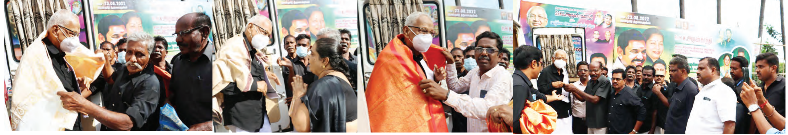
திருவாரூருக்கு வருகை தந்த தமிழர் தலைவருக்கு மாவட்ட கழகப் பொறுப்பாளர்கள் பயனாடை அணிவித்து வரவேற்பு அளித்தனர். (22.8.2022)