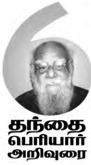
தந்தை பெரியார் அறிவுரை

பழக்கதால் பாழாகும் வணிகம் மடம், நானம், அச்சம், பயிர்ப்பு, கற்பு என்பவை ஆடலர்களுக்கும், பெண்களுக்கும் பொதுவாக உள்ளதென்பதே பெண்களுக்கு மாதிரியும் என்று சொல்லுது நியாயம் ஆகாது. பெண்கள் சிறு குழந்தைகளிலிருந்து ஆடலும், பேயாடும் பழகியும் வருகிறார்கள். இதனால் தான் அவர்களுடைய வயது காலங்களில் அழகுபெறாமல் போய்விட்டன. இரக்கமின்றியே, இறந்து போய் விட்டதன் துக்கத்தினால் அழகாகியதற்குப் பேய்கள் பிடித்து ஆடக்கூடியதாகவும் இருக்கின்றன என்று சொல்ல முடியாது.