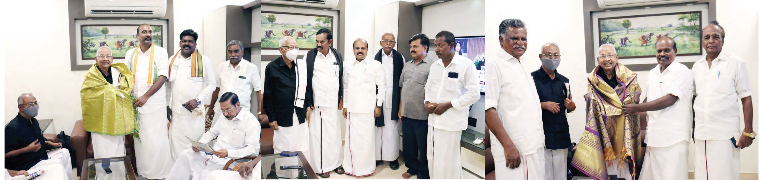
அகில இந்திய காங்கிரஸ் கட்சியின் மாவட்ட பொறுப்பாளர்கள், மதி.மு.க. மாவட்ட பொறுப்பாளர்கள், இந்திய கம்யூனிஸ்ட் கட்சியின் மாவட்ட பொறுப்பாளர்கள் தமிழர் தலைவருக்குப் பயனாடை அணிவித்து வரவேற்றனர்