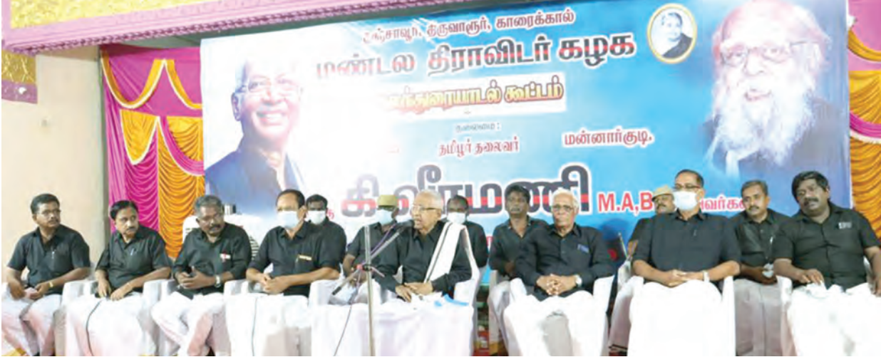
பழைய தஞ்சை மாவட்டத்தினுடைய ஒருங்கிணைந்த ஒரு கூட்டம்தான் இந்தக் கலந்துரையாடல் என்பதாகும்.

மற்றும் இயக்கப் பொறுப்பாளர்களே, இயக்கக் குடும்பத்தவர்களே, செயல்வீரர்களே உங்கள் அனைவருக்கும் என்னுடைய அன்பான வணக்கத்தினைத் தெரிவித்துக் கொள்கிறேன்.