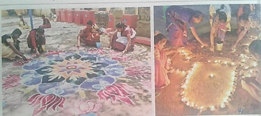
பூமி தினத்தை முன்னிட்டு விருதுநகர் அருங்காட்சியகத்தில் கோலமிட்டு அலங்கரித்த மாணவிகள். அடுத்தபடம்: சிவன் கோயிலில் சிவலிங்க கோலமிட்டு தீபம் ஏற்றிய பெண்கள்.