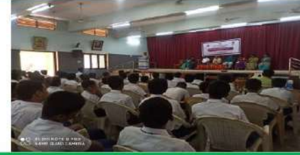
ஆட்சிமொழி விழிப்புணர்வுப் பட்டிமன்றம்