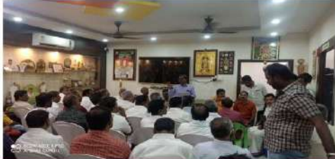
வணிக நிறுவனங்களுடன் கலந்தாய்வுக் கூட்டம்