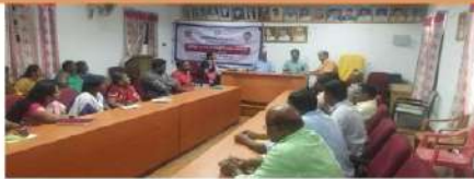
திருச்சிராப்பள்ளி மாவட்டம் அந்தநகரூர் ஊராட்சி ஒன்றியத்தில் - ஆட்சி மொழித் திட்ட விளக்கக் கூட்டம்