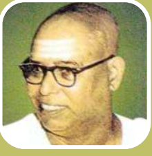
வாகீச கலாநிதி கி.வா.ஜ.