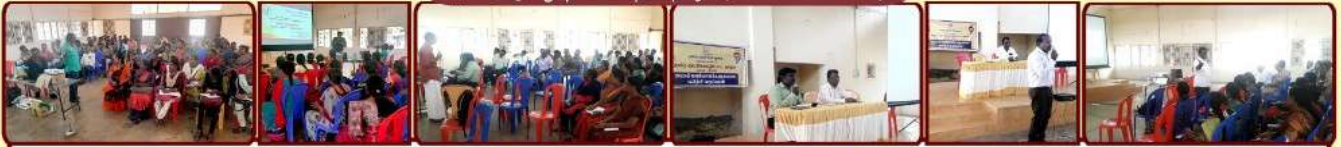
அரசுப் பணியாளர்களுக்கான பயிற்சி வகுப்புகள்

இரண்டு, மூன்று, நான்காம் நாள் நிகழ்வு (22, 23, 24.02.2023)