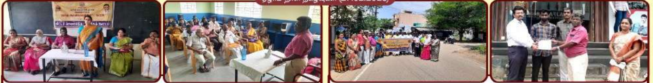
திட்டச் செயலாக்க விளக்கக் கூட்டம்