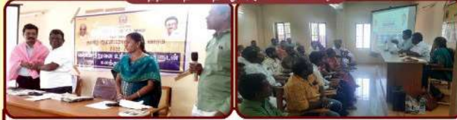
வணிக நிறுவன உரிமையாளர்களுடன் கலந்துரையாடல்