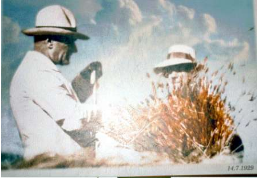
Atatürk ve Tahsin Coşkan