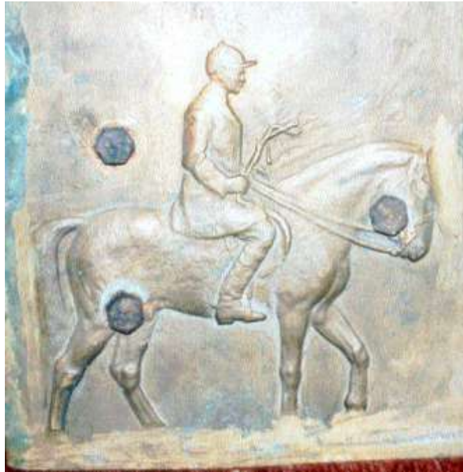
Bozuk olarak kabul edilen binici rölyefi, diğer bir büstün alt kaidesi altını oluşturmuş.