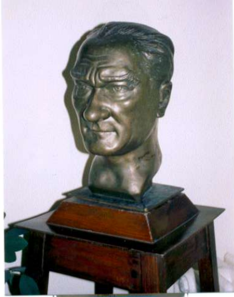
AOÇ:'de dökümü 1930-1931 yıllarında 10-12 adet dökülmüş Atatürk Büstü.