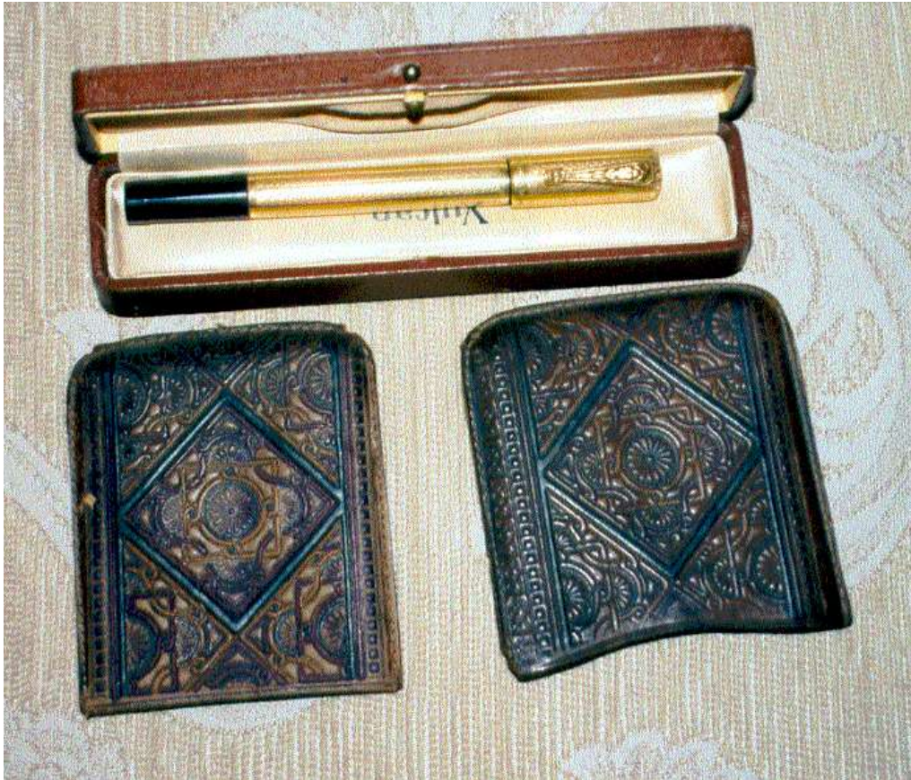
Atatürk'ün Çiftlik vekâletnâmesini imzalayıp Tahsin Coşkan'a hediye ettiği dolmakalem ve sigara muhafazası.