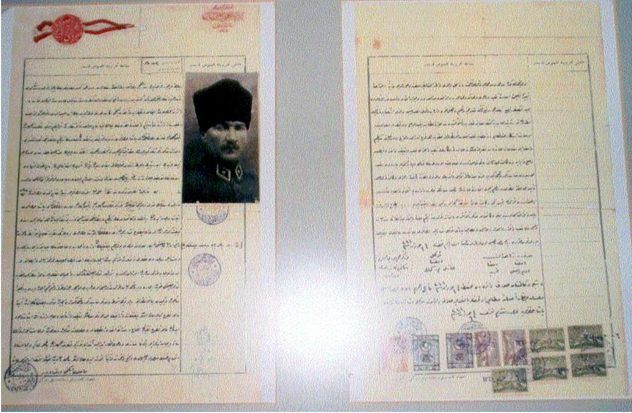
Gazi Mustafa Kemâl'in 06.06.1925 tarihli AOÇ. Vekâletnâmesi