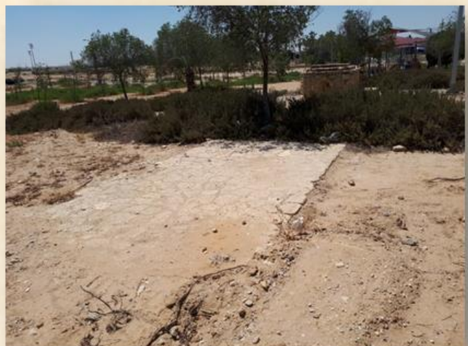
רצפת בית המכס: שלמה ציזר

בית המכס לא הצליח להצר את רגלי ההתיישבות בנגב. במלחמת העצמאות נהרס מבנה בית המכס.