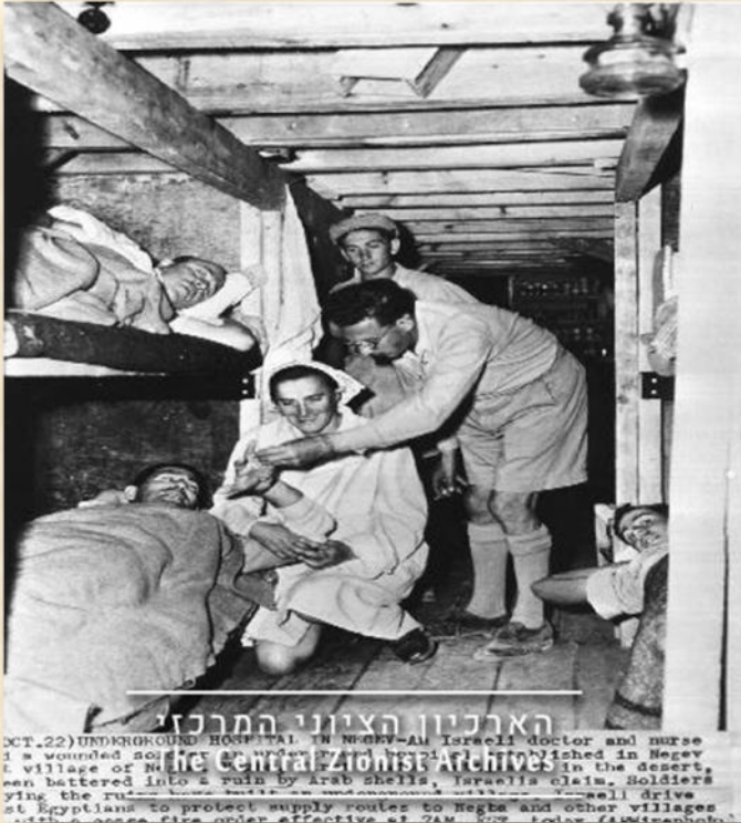
נגבה במלחמת העצמאות מרפאה תת קרקעית

עוד שני חברי נגבה נפצעו. כתוצאה מהאירוע, סללו חברי נגבה את כביש ה"סולינג" (ריצוף אבנים) לכיוון ג'וליס. הלקח השני היה בניית מגדל-מים מבטון. [יום העליה לנגבה, סיפורנו- מאיר מינדל].