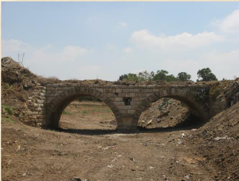
גשר רכבת עות'מנית על נחל אלה (קריית מלאכי) בתואי א-תינה (כפר מנחם) בית חנון: עפר יוגב

בשנת 1929, בהיותו מוצב במחנה ואדי-סראר/שורק, ראה השוטר שמואל ווייסברג את בית-הרצל שליד חולדה מותקף על-ידי המון ערבי והזעיק עזרה ממחנה רמלה. כך הציל את חיי הפועלים בחווה (להוציא את ציזיק שנהרג) שפוונו לתל אביב.