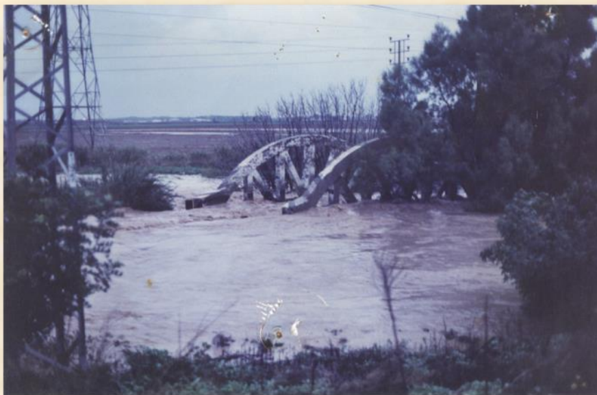
גשר הקשתות על נחל לכיש בהצפה