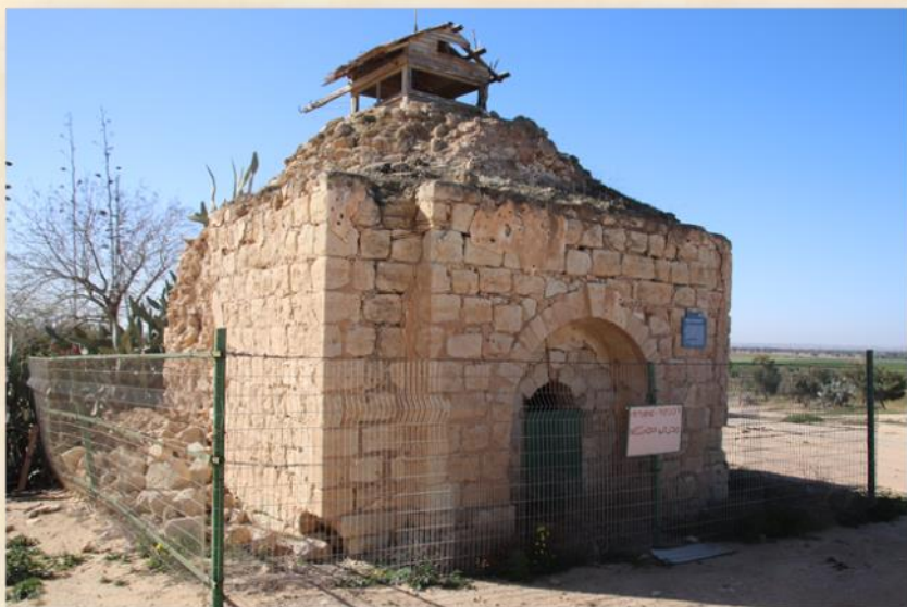
שיחי' (נבי) נוראן (קיבוץ מגן): עפר יוגב