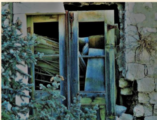
פרטים מיוחדים בצילומים: יהודה הוכמן