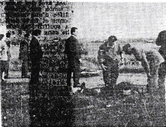
Le fossé. plan, M. Auriaac reçoit les.

Priore, Ensuque, Hirailles, Dauly, Nicole, Vailler, Iff, Apparicci, Niquet, Legrand, Méric, Bénézech, Delmas.