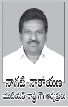
నాగటి నారాయణ యుటియఫ్ రాష్ట్ర గౌ||అధ్యక్షులు

పాఠశాల విద్యాశాఖ విడుదల చేసిన జిఓ 40తో ఎయిడెడ్ విద్యా వ్యవస్థ పతనానికి ప్రభుత్వం ప్రణాళిక సిద్ధం చేసింది. విద్యార్థులు 30లోపు వుండే ప్రాథమిక పాఠశాలలు, ప్రాథమికోన్నత పాఠశాలల్లోని 6,7 తరగతుల్లో 30మందిలోపు వుంటే అవి, 6-10 తరగతుల్లో 75మందిలోపు విద్యార్థులు వుండే హైస్కూళ్లను దండగమారి పాఠశాలలుగా ప్రభుత్వం ప్రకటించింది. ఆయా పాఠశాలల్లో ప్రభుత్వ ఖర్చుతో నడుస్తున్న టీచర్ పోస్టులను రద్దు చేస్తోంది. ఆ పోస్టుల్లో పనిచేస్తున్న ఉపాధ్యాయులను వేరే చోటికి పంపిస్తారు.