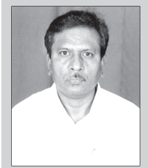
ఎం.కోటేశ్వరరావు ప్రముఖ పాత్రికేయులు