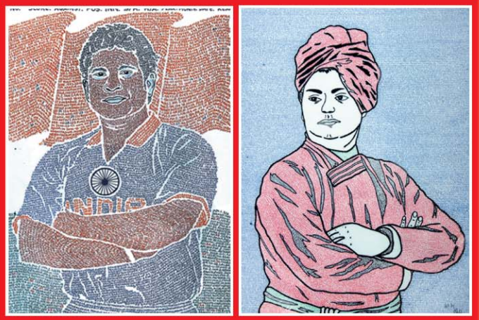
ఐకోనో గ్రేటింగ్ తో వేసిన చిత్రాలు

- ఎస్ కే ఎం డి గౌసబాషా, చెన్నయ్