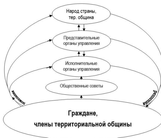
Рис. Общая схема общественного самоуправления

Вместе с тем в странах с развитой демократией уже можно вычлнить то исторически сформировавшееся общее, что потребует всего лишь дальнейшего развития и совершенствования под задачи гармоничного общества. Таким образом соавторами Манифеста была выработана и предлагается к рассмотрению универсальная схема общественного самоуправления на уровне страны и на каждом уровне административно-территориального деления, начиная с территориальных общин населенных пунктов и их внутренних структурных образований. Схема представлена на нижеприведенном рисунке, где восходящими стрелками обозначены пожелания, инициативы, проекты..., а нисходящими – принятые решения.