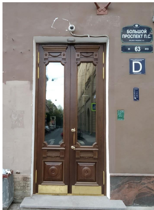
Большой проспект Петроградской стороны, 63