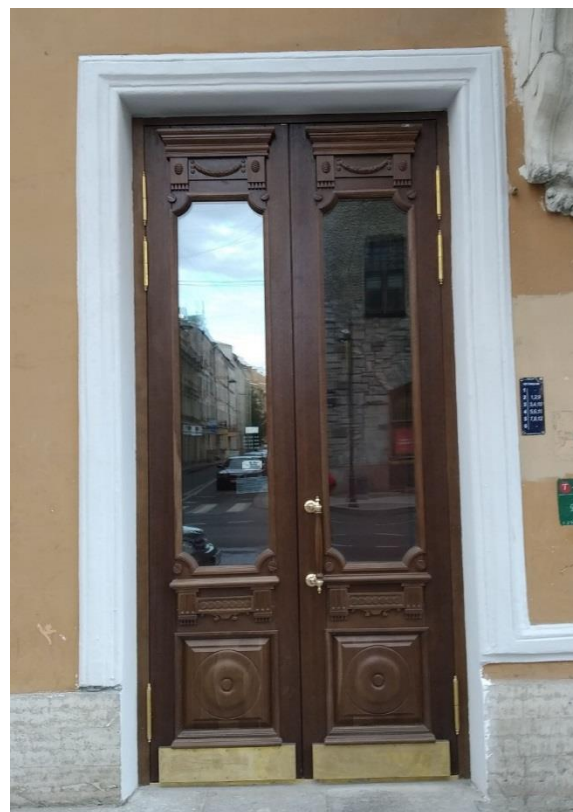
Большой проспект Петроградской стороны 33А