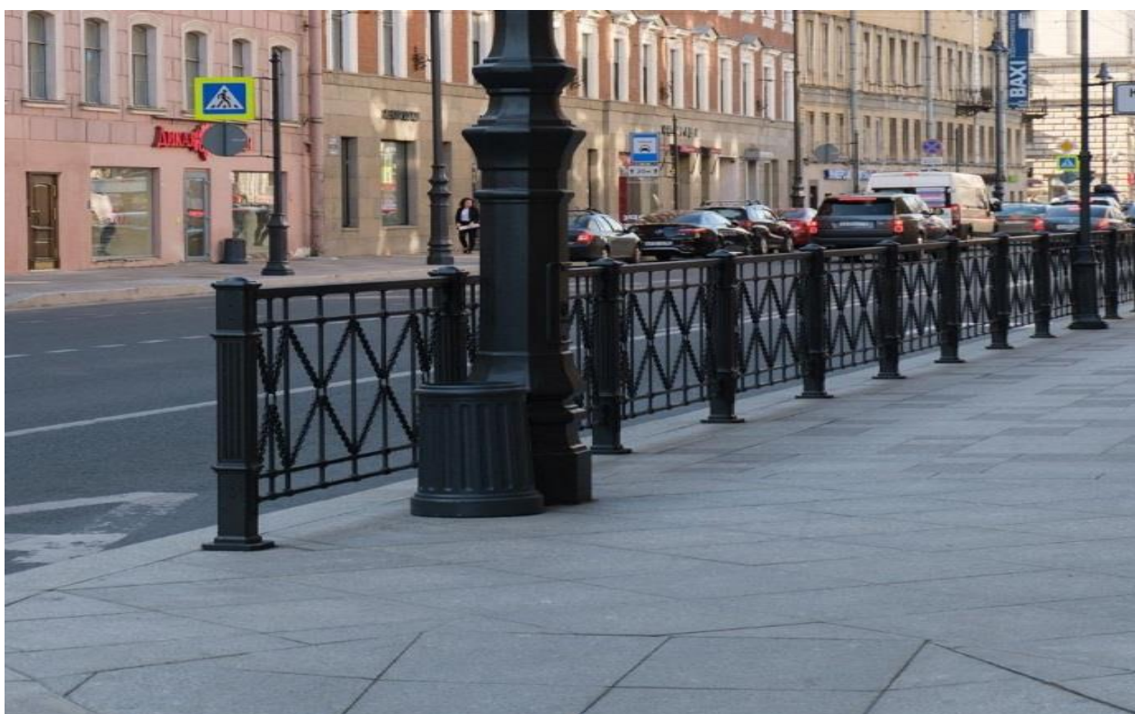
Большой проспект Петроградской стороны