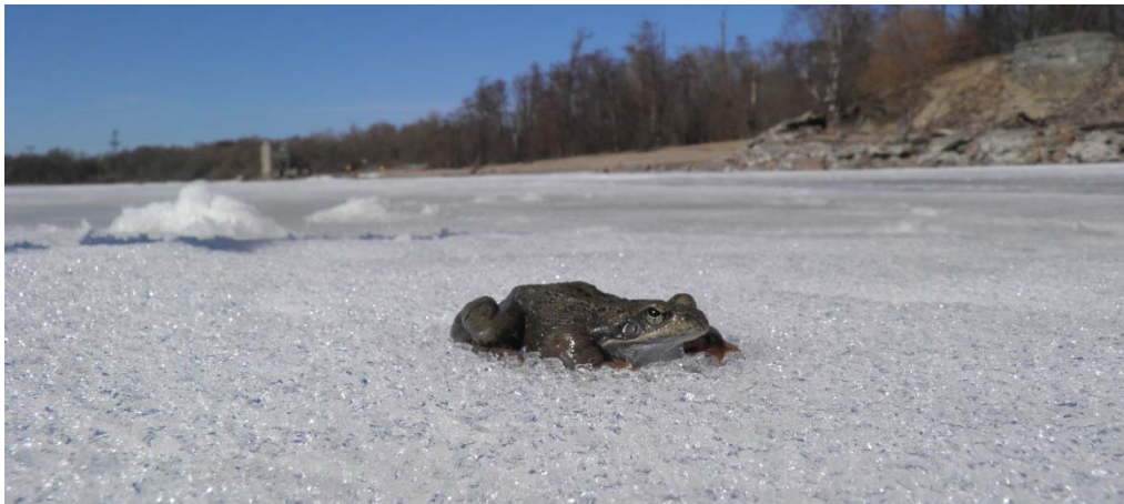
Травяная лягушка после зимовки на мелководье Финского залива начинает миграцию

Миграционные коридоры амфибий — это пути, на которых животные движутся узким фронтом. Информация о таких коридорах, местах их пересечения с дорогами, видовом составе и численности мигрирующих амфибий представляет не только научную ценность, но и может стать основой для разработки мер по снижению гибели животных. Поэтому важно не только оказывать помощь мигрирующим через дороги животным, но и просто собирать информацию о них.