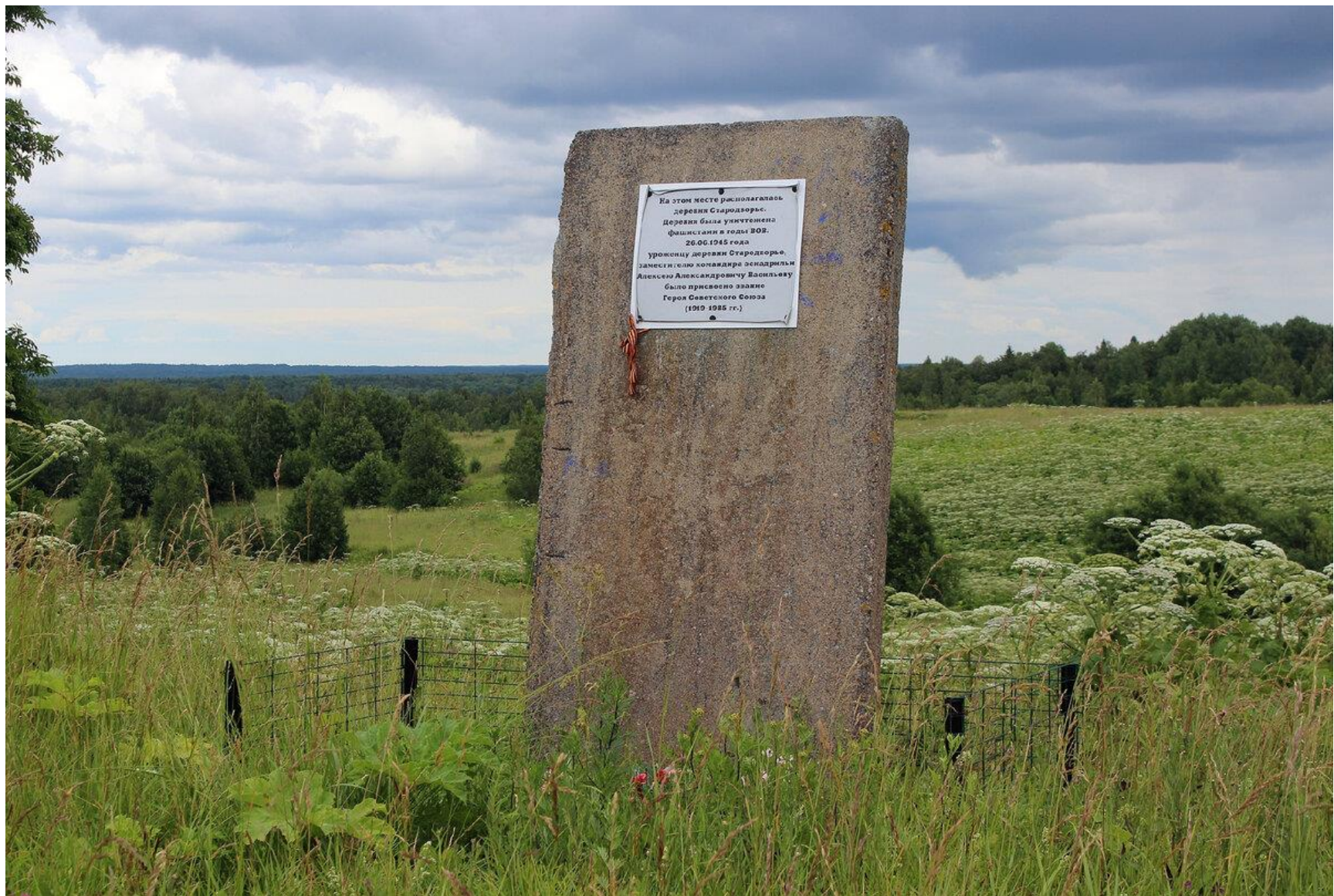
Памятник деревне Стародворье, уничтоженной фашистами в годы ВОВ. Около 2,5 км на север д. Лопухинка, Ломоносовский район