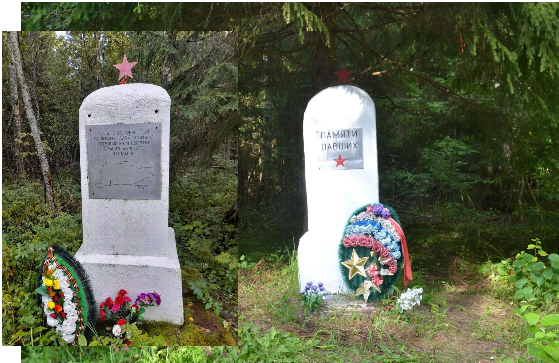
Мемориал «Памяти павших» - два расположенных напротив друг друга памятника-обелиска 3,5 км от дер. Воронино в сторону Соснового Бора, слева от автодороги