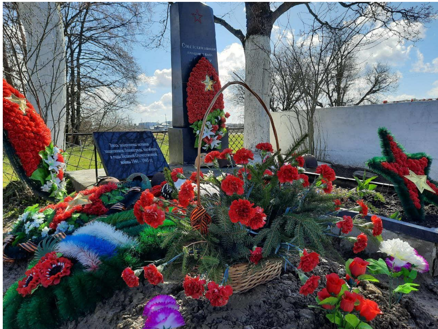
Братское захоронение советских воинов, погибших в 1941-44 гг., в том числе – Героя Советского Союза Вересова В.И. (1913 – 1941) (объект культурного наследия регионального значения) Дер. Глобицы, Ломоносовский район