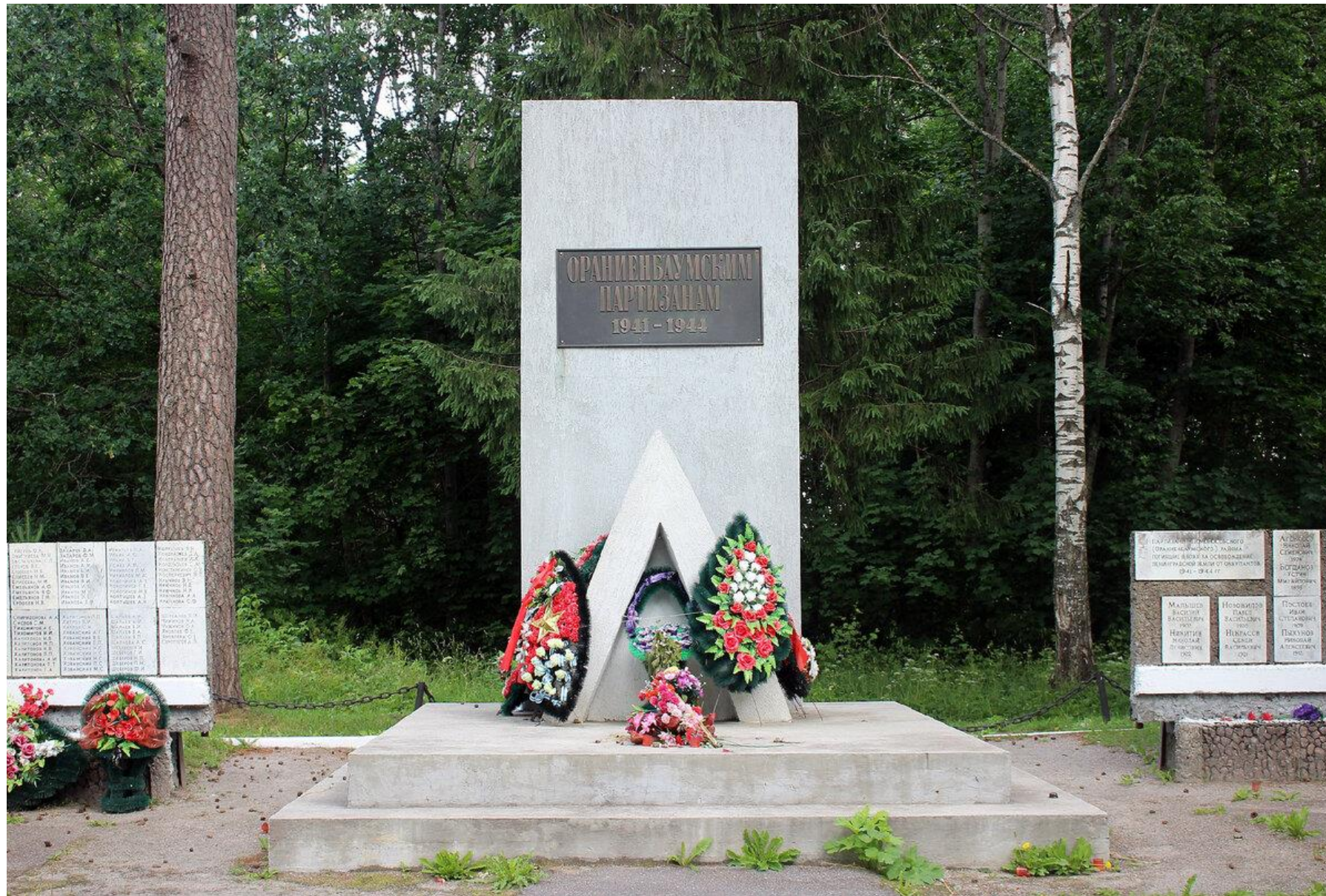
Мемориал «Шалаш» (объект культурного наследия регионального значения) Дер. Лопухинка, Ломоносовский район