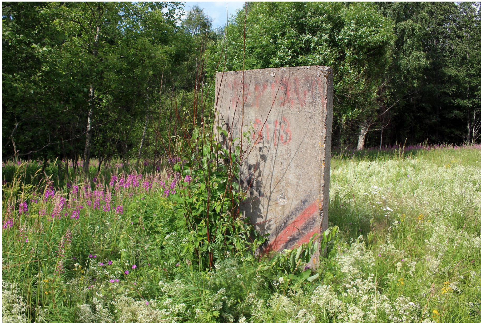
Памятник сожженной деревне Терентьево урочище Терентьево, дер. Лопухинка, Ломоносовский район