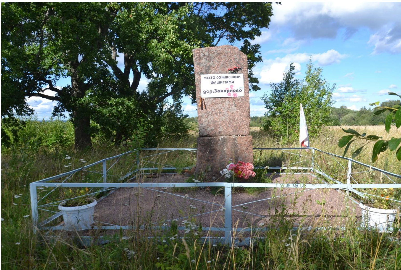
Памятный знак-стела на месте сожженной фашистами дер. Закорново (объект культурного наследия регионального значения) В 10 км к западу от дер. Лопухинка, Ломоносовский район