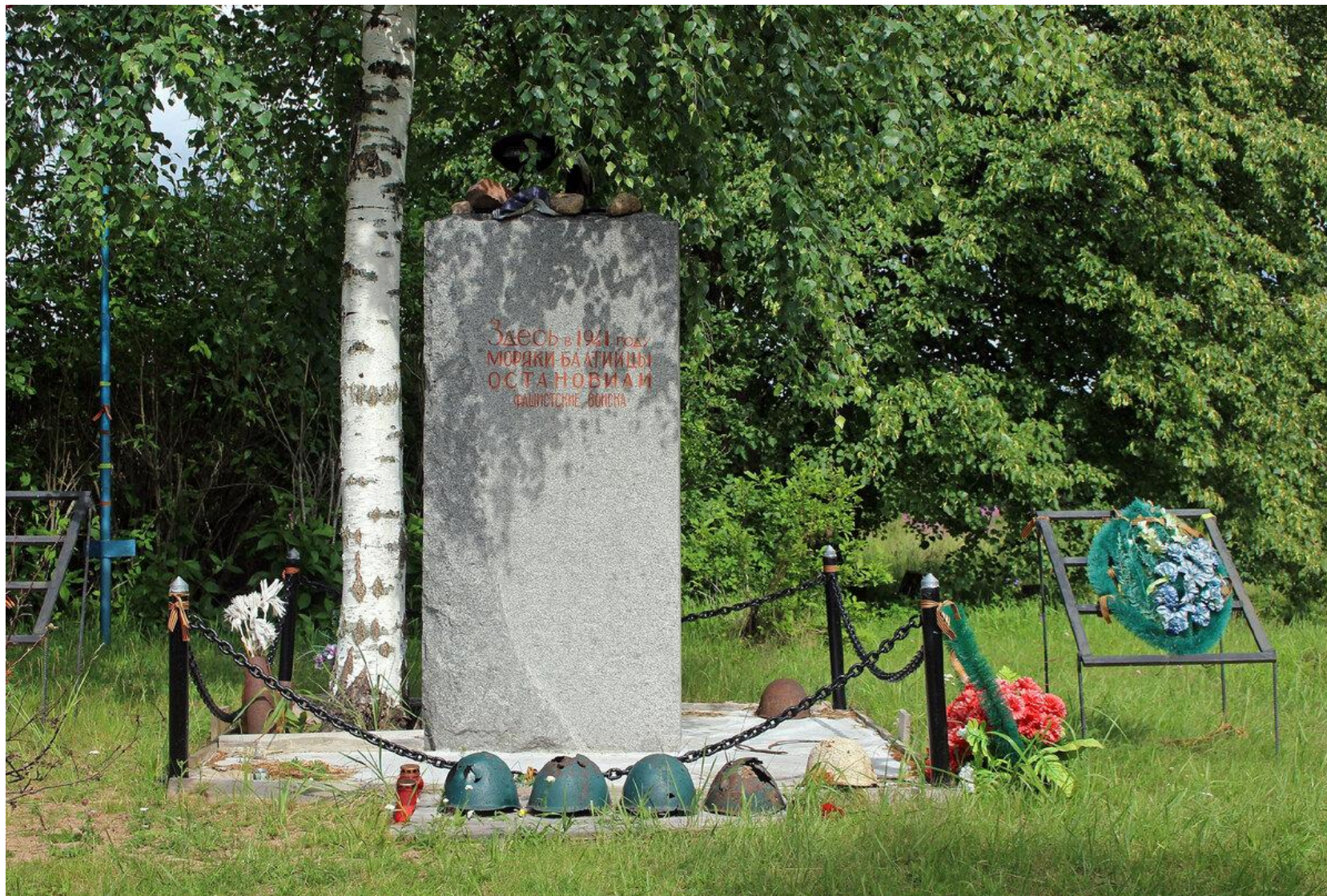
Мемориал «Дальний рубеж» (объект культурного наследия федерального значения). Урочище Терентьево, дер. Лопухинка, Ломоносовский район - в 5,5 км от деревни на берегу реки Лопухинка