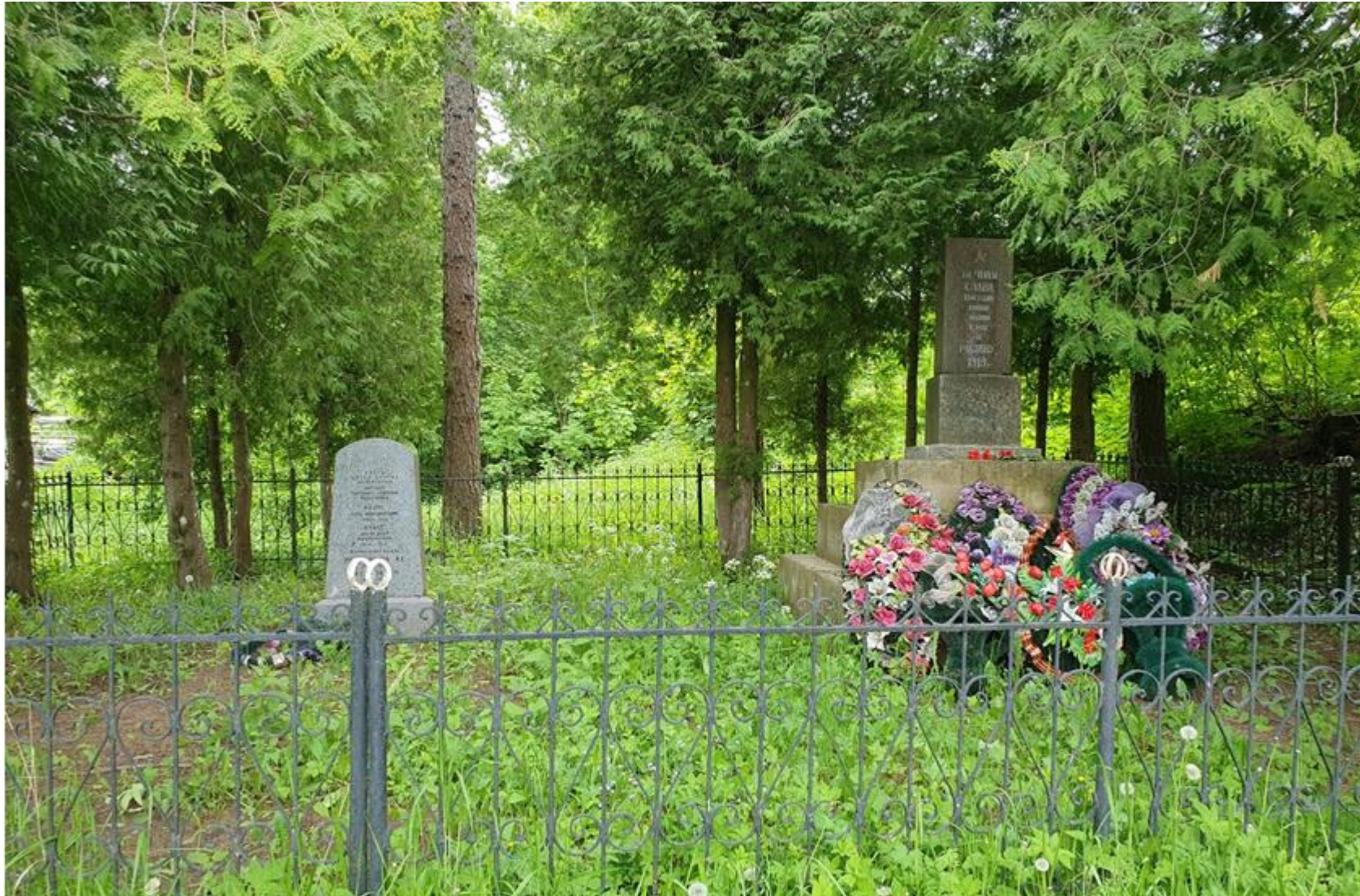
Братская могила красноармейцев и советских воинов, погибших в гражданскую и Великую Отечественную войны (объект культурного наследия регионального значения) Дер. Лопухинка, Ломоносовский район