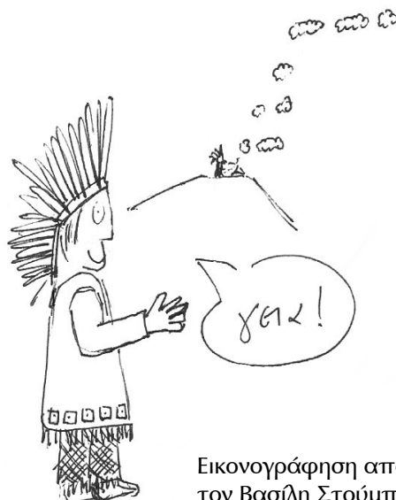
Εικονογράφηση από τον Βασίλη Στούμπο

Στη δραστηριότητα αυτή, κάθε ομάδα καλείται να μεταδώσει στις υπόλοιπες ένα μήνυμα, χρησιμοποιώντας διαφορετικό κώδικα (ο οποίος είναι γνωστός στους παραλήπτες), αλλά και διαφορετικό μέσο μετάδοσης. Στόχος της δραστηριότητας είναι η συσχέτιση των αναπαραστάσεων που κάνουν χρήση των συμβόλων 0 και 1 με άλλες, περισσότερο οικείες, δυαδικές αναπαραστάσεις. Κάθε αναπαράσταση με δυαδικά ψηφία προβάλλεται απλά ως “άλλη μία” (yet another) δυαδική αναπαράσταση. Ένας επιπρόσθετος στόχος είναι η ανάδειξη της φυσικής υπόστασης της πληροφορίας στα πραγματικά συστήματα που την μεταδίδουν, την αποθηκεύουν και την επεξεργάζονται.