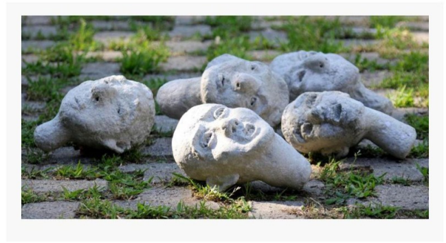
Le statue fatte da carta pesta