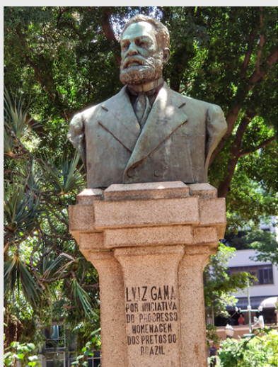
Monumento a Luiz Gama Registro da pesquisadora