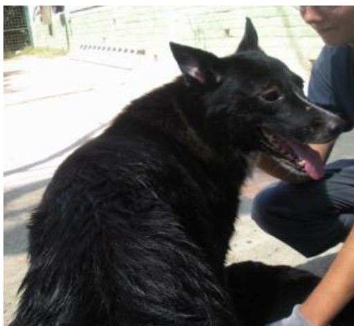
Rick, Schäfi-Mix, 2004 geb. Rüde, kastriert

Rick ist ein lebhaftes und aufgewecktes Bürschlein. Er leidet wahnsinnig unter der fehlenden Aufmerksamkeit. Er lebte jahrelang mit Bolo zusammen. Seit Bolos Tod kam er in einen Massenzwinger. Rick lebt momentan mit weiteren Hunden im Gemeinschafts-Zwinger und ist mit jedem Hund und bisher auch mit jedem Menschen gut verträglich. Er braucht dringend ein liebevolles Zuhause