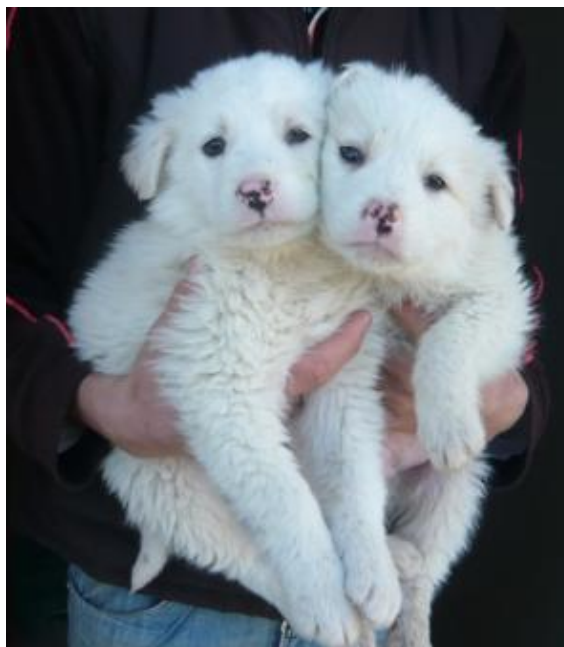
6 Maremmanenwelpen 3 Monate alt

5 kleine weiße Wollknäuel und 1 schwarz-weißes sind so zart, so zerbrechlich, so hilflos hinter Gittern in einem offenen Zwinger. Sie kennen die Einsamkeit des nackten, kalten Zwingerns, sie genießen den kurzen Augenblick des Fototermins auf dem Arm der Freiwilligen, diesen kurzen Moment spüren sie die Wärme und Geborgenheit, die ihnen so fehlt. Sie brauchen ein liebevolles Zuhause in einer Familie, die sie ihr ganzes Leben nicht mehr weggibt.