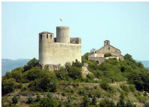
PALLARS-JUSSA .- CASTILLO DE MUR