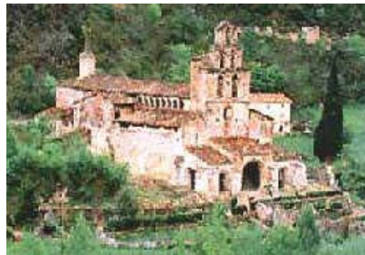
PALLARS-SOBIRA .- MONASTERIO DE SANTA MARIA DE GERRI