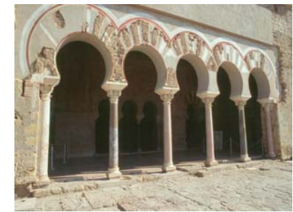
PALACIO MEDINA AZAHARA