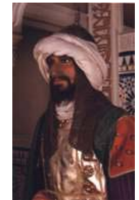
ALMANZOR Museo de cera de madrid