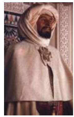
ABD AL-RAHMAN III Museo de cera de Madrid

MUHAMMAD AL-MAHSI REY DE ALGECIRAS (< 1022 - 1048 >)