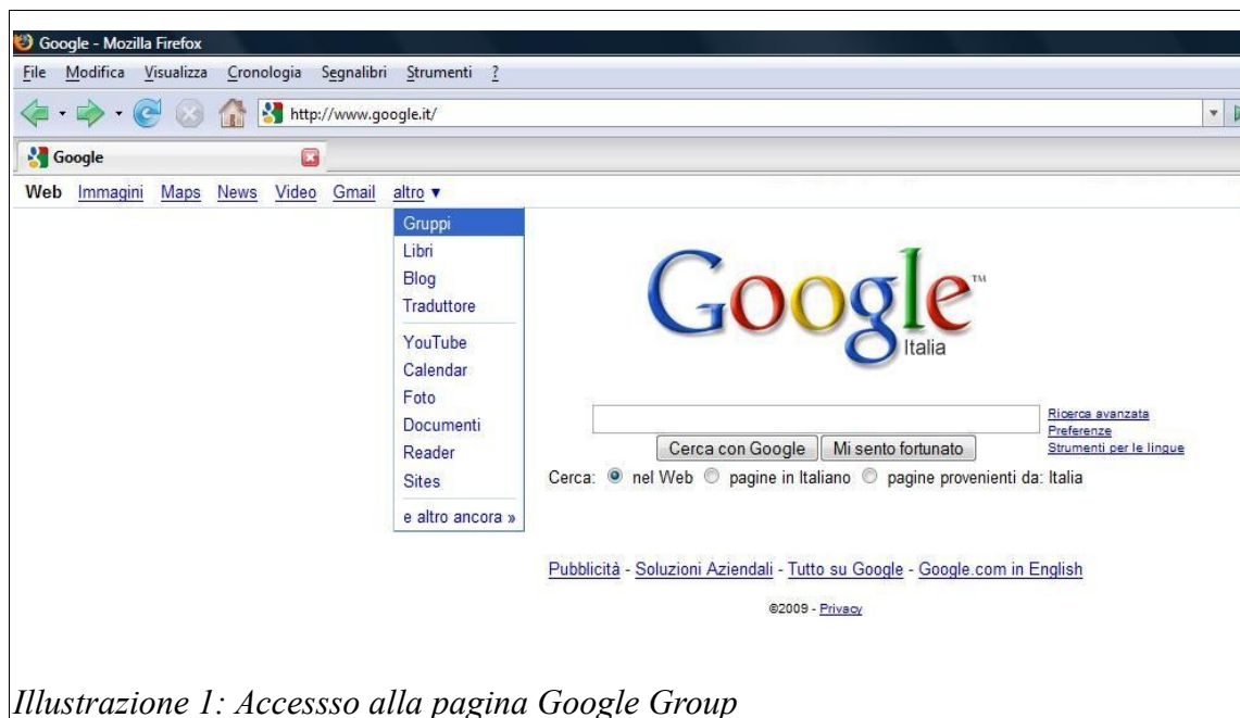
Illustrazione 1: Accesso alla pagina Google Group

Per creare un account con Google Group dovrete dapprima visualizzare la pagina dei gruppi di Google (normalmente tale pagina è accessibile direttamente dalla pagina principale di Google attraverso il menu “altro”, vedi illustrazione 1),