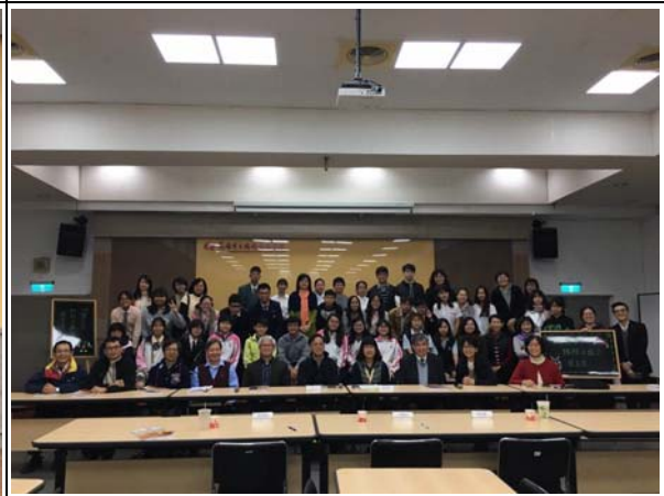
參賽學生與評審教授師長們合影