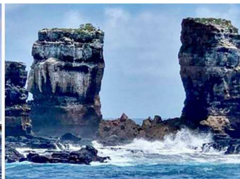
▲二零二一年五月十七日，厄瓜多尔环境部公布：“达尔文拱门”崩塌。左图是坍塌前的拱门。右图显示，该拱门仅剩下两根柱子。