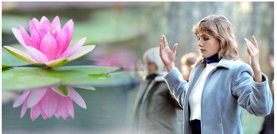
法轮功第二套功法演示

他说：“我们当初那么为共产党卖力，现在却成了共产党要清除的‘害群之马’。你说讽刺不讽刺？”◇